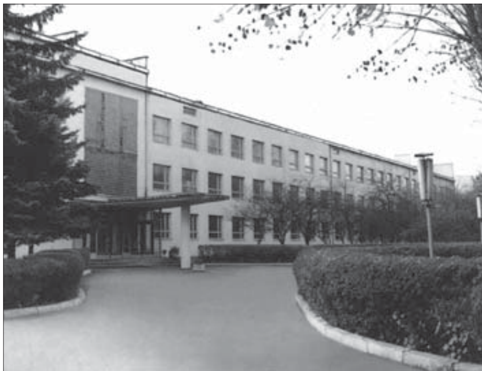
Центральний корпус Фізико-механічного інституту ім. Г.В. Карпенка НАН України

Понад 35 років ми друкуємо науково-технічний журнал «Фізико-хімічна механіка матеріалів», який став провідним із проблем фізико-хімічної механіки руйнування і міцності матеріалів, впливу на останню середовища, зокрема корозійного і воденьвмісного, дії дефектності структури матеріалів на їхню міцність, теорії, методів, технологій захисту металів від корозії тощо. Журнал під