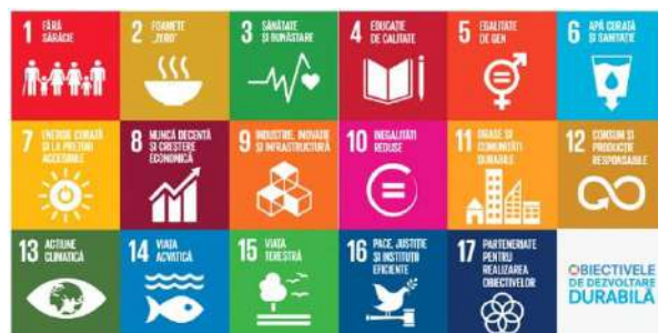
Figure 1. Sustainable Development Goals (ODG/SDGs)

Although, initially, it was only desired to preserve the quality of the environment in the affected geosystems, later, the concept of sustainability was reformulated as durability. Thus, in September 2015, within the UN General Assembly, leaders of countries around the world assumed the 2030 Agenda for sustainable development and adhered to 17 Sustainable Development Goals (ODG/SDGs), as follows: (1) No poverty, (2) No Hunger, (3) Health and Welfare, (4) Quality Education, (5) Gender Equality; (6) Clean water, (7) Affordable clean energy, (8) Decent work and economic growth, (9) Industry, innovation and infrastructure, (10) Reduced inequality, (11) Sustainable cities and communities, (12) Responsible consumption and production, (13) Climate action, (14) Life underwater, (15) Life on land, (16) Peace, justice and strong institutions, and (17) Partnership to achieve the Goals [11]. (Fig. 1).