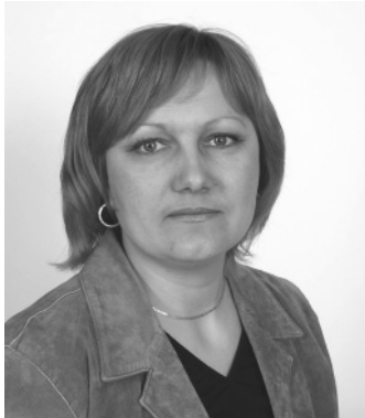
А.М. Бірюкова, проректор Академії адвокатури України