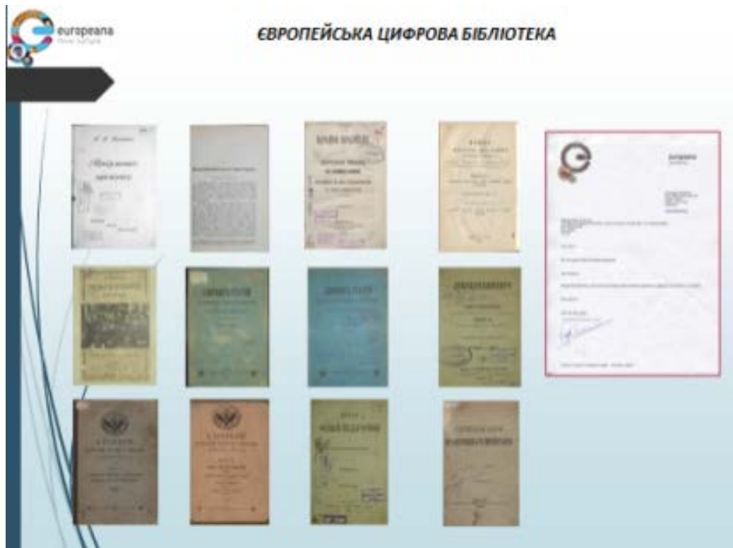
Рис. 4. Оцифровані книги для Європіани

Створення та активне формування електронних ресурсів, зокрема електронного каталогу та Науково-педагогічної електронної бібліотеки ДНПБ України ім. В. О. Сухомлинського, електронних тематичних і проблемно-орієнтованих баз даних, значно підвищують оперативність бібліографічного пошуку інформації та дадуть можливість розпочати нові сервіси. Про перспективи використання ДНПБ України ім. В. О. Сухомлинського програмно-технологічних інструментів для репрезентації оцифрованих книжкових пам'яток, що становлять національне надбання України, йдеться у Стратегії розвитку Державної науково-педагогічної бібліотеки України імені В. О. Сухомлинського на 2017–2026 роки (за ред. Л. Д. Березівської, 2017 р.) [5].