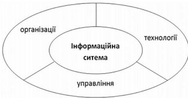
Рис. 1. Структура інформаційної системи

3) технологічні — апаратне та програмне забезпечення, засоби зберігання даних, засоби комунікацій, комп’ютерна мережа, що утворюють єдину інформаційну інфраструктуру [2, с. 15].