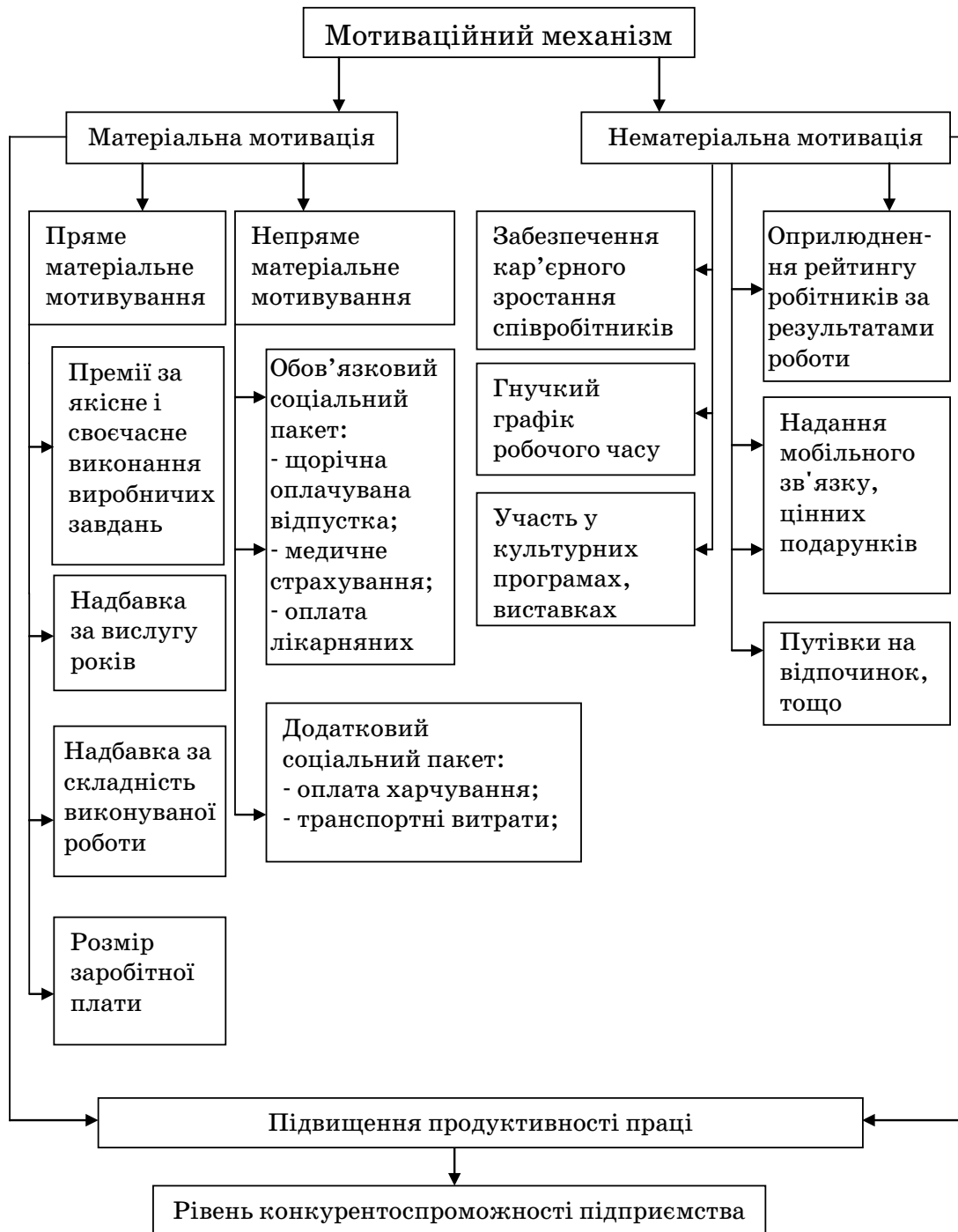
Рис. 1. Схема мотиваційного механізму управління персоналом

Нематеріальна складова мотиваційного механізму управління персоналом навпаки повинна сприяти