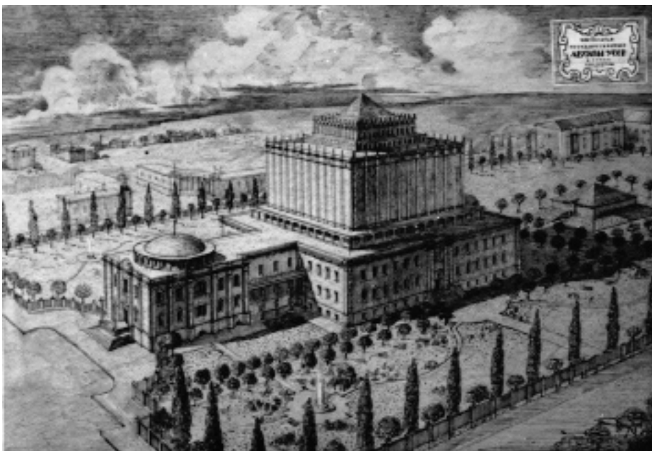
Проект комплексу центральних державних архівів УРСР у м. Києві (автор проекту – архітектор В. Тищенко). Репродукція. (ЦДКФФА України ім. Г. С. Пшеничного, од. обл. 4-1367)

(ЦДКФФА України ім. Г. С. Пшеничного, од. обл. 0-314)