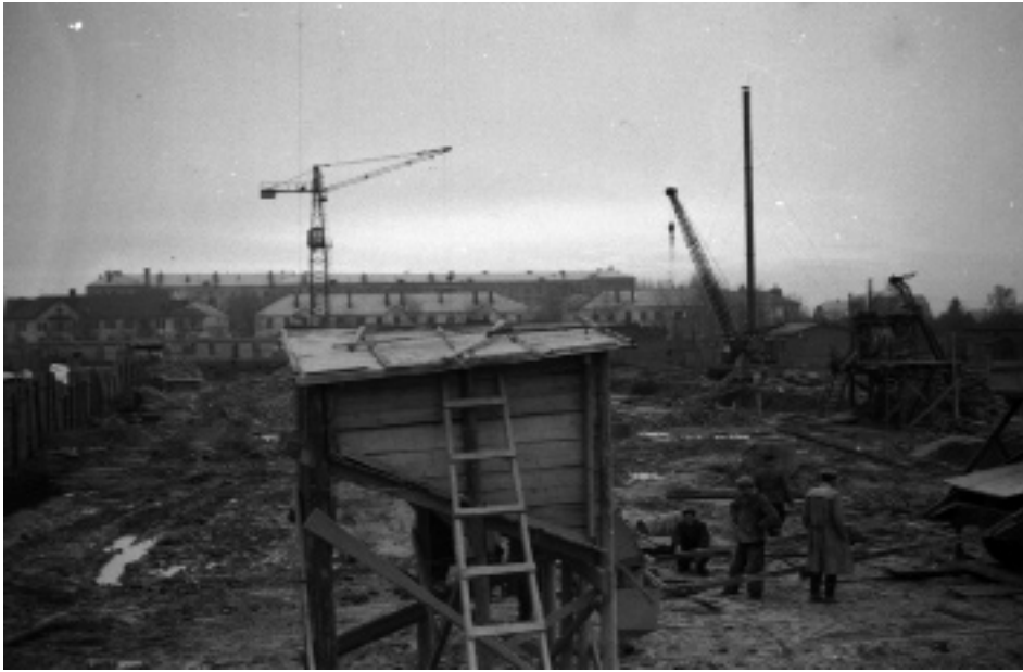
Загальний вигляд будівельного майданчика під спорудження будинку центрального архіву України. Київ, листопад 1960 р. (ЦДКФФА України ім. Г. С. Пшеничного, од. обл. 0-70440)