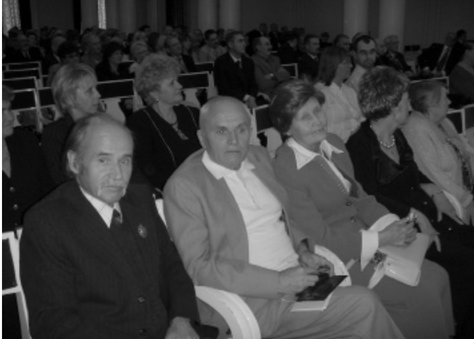
Учасники урочистого засідання. 14 вересня 2007 р.

установ України”, в якій взяли участь керівники галузі та директори центральних архівів.