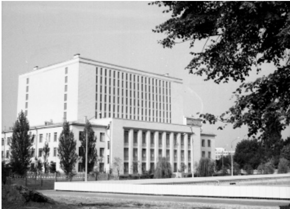
Головний корпус комплексу центральних державних архівів УРСР. На передньому плані – басейн для підтримання температурного режиму в архівосховищах. Київ, 1973 р. (ЦДКФФА України ім. Г. С. Пшеничного, од. обл. 2-96802)