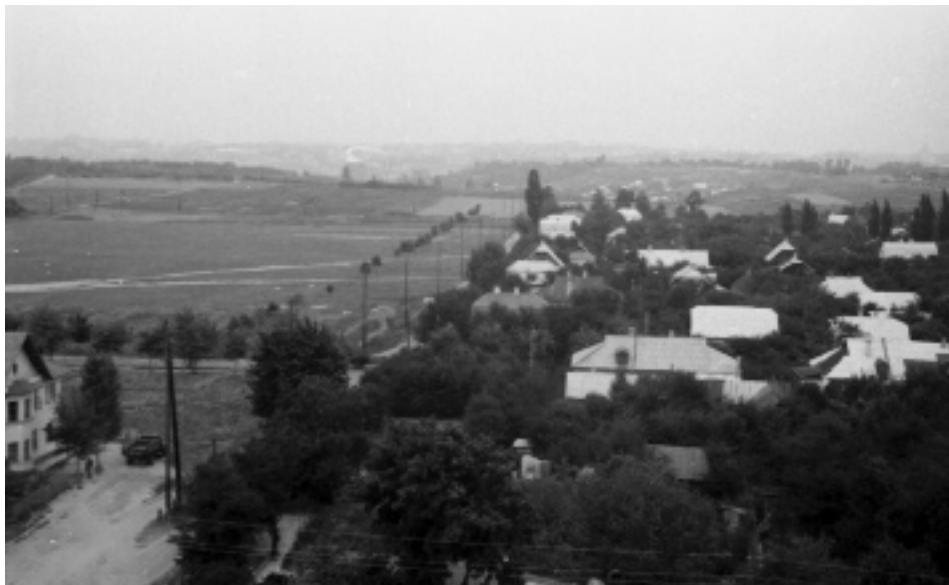
Місце будівництва архівного містечка в Олександрівській слободі в м. Києві, 1959 р.