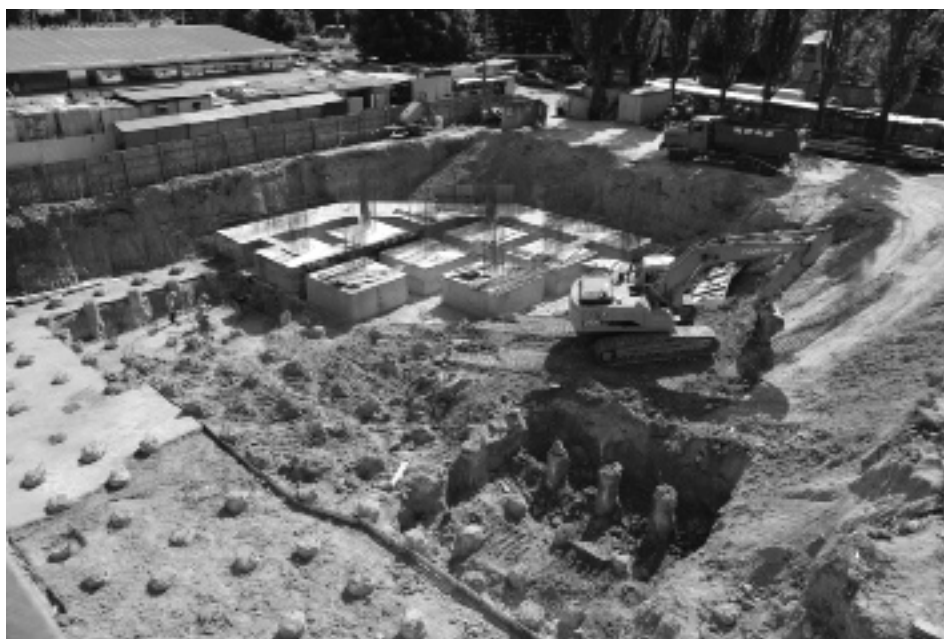
Будівельний майданчик нового корпусу комплексу. 10 червня 2008 р.