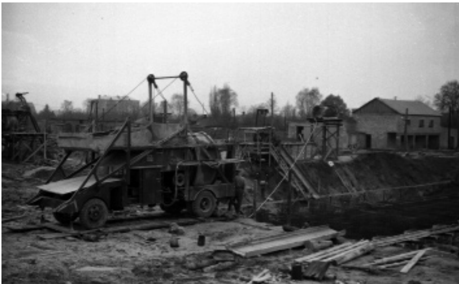
Зведення цокольного поверху будинку центрального державного архіву України. Київ, листопад 1960 р. (ЦДКФФА України ім. Г. С. Пшеничного, од. обл. 0-70439)