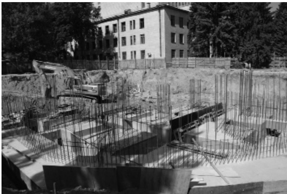
Бетонування фундаменту нового корпусу комплексу центральних державних архівів України, Київ. 10 червня 2008 р.