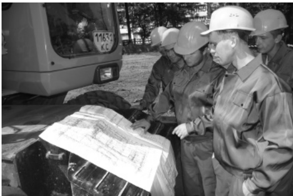
Будівельники вивчають проект майбутньої будівлі. 22 серпня 2007 р.