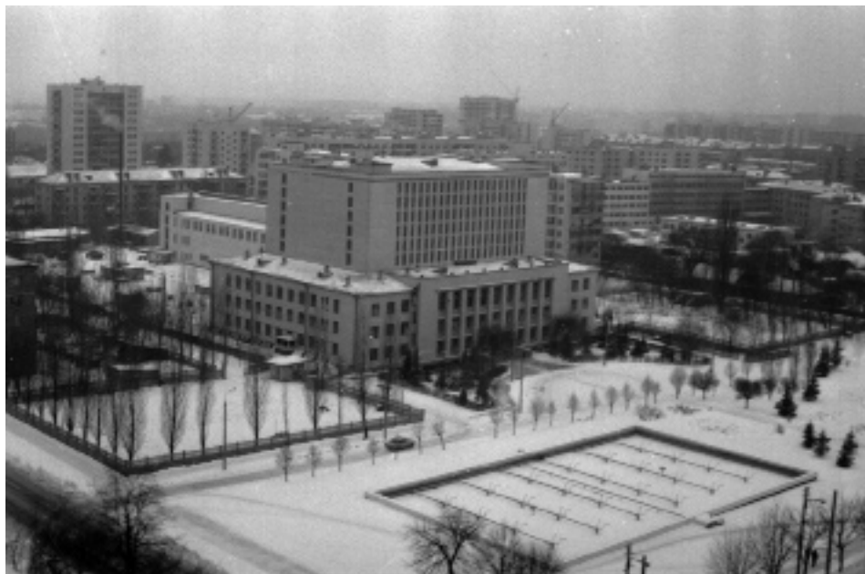
Вид м. Києва. На передньому плані – будинок центральних державних архівів УРСР. 1977 р.