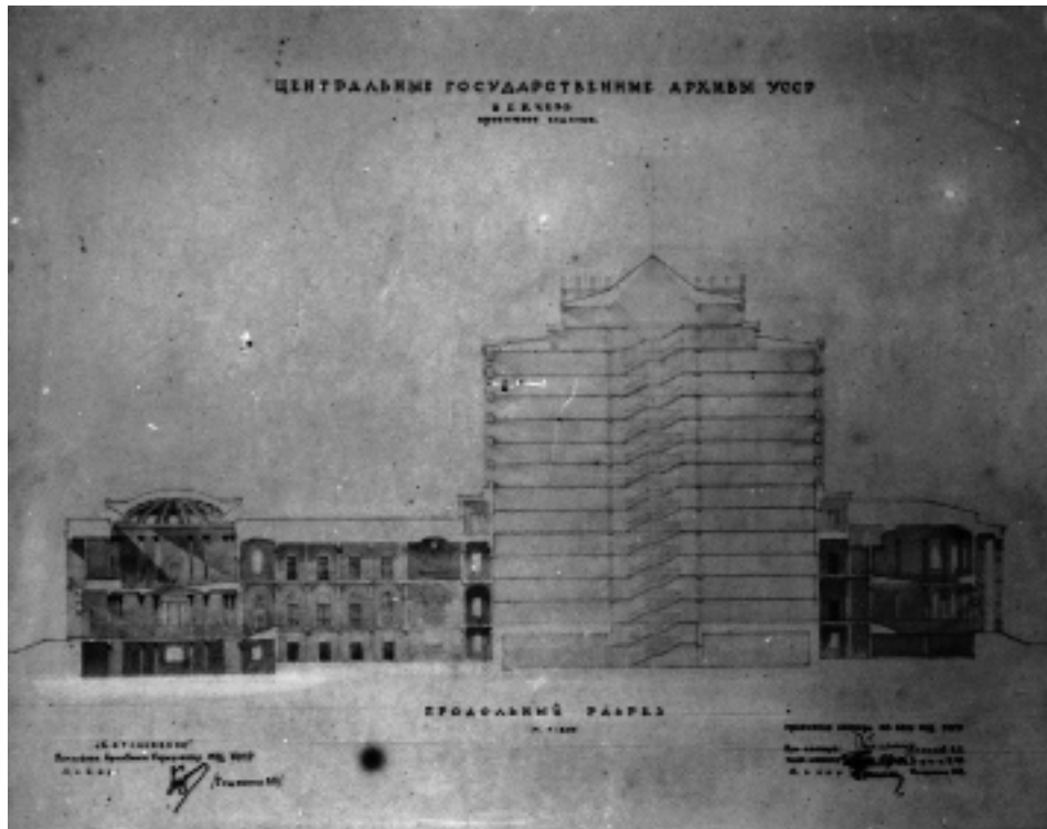
Проект будівлі центральних державних архівів УРСР у м. Києві. Повздовжній розріз. (ЦДКФФА України ім. Г. С. Пиєничного, од. обл. 4-1373)