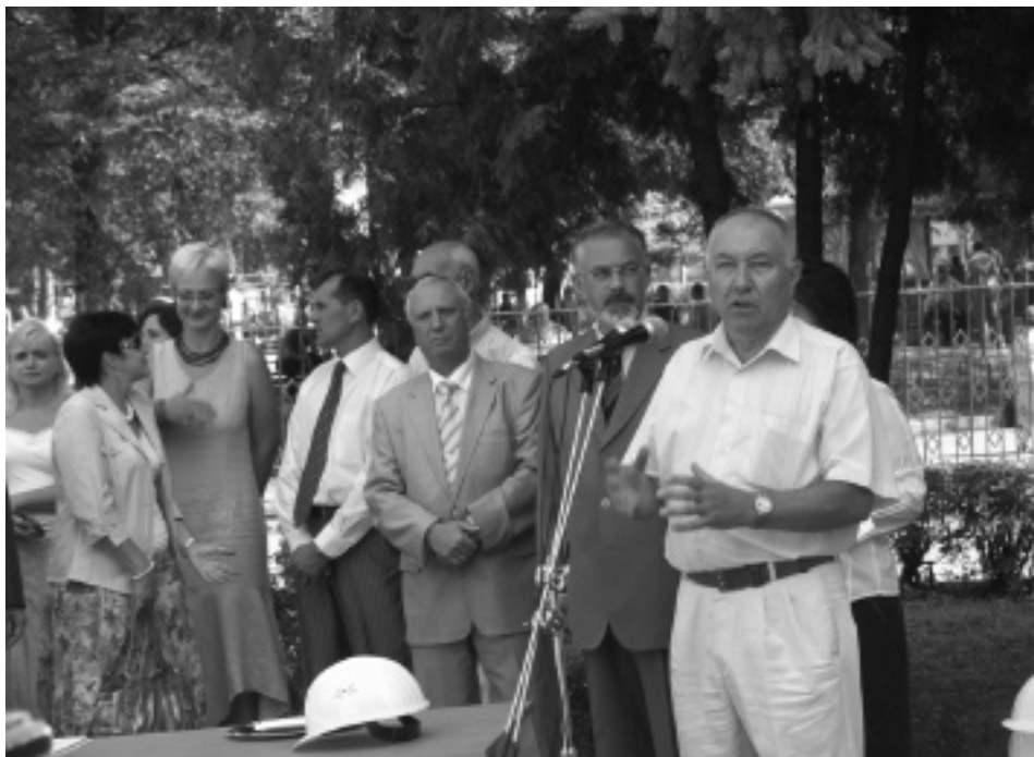
Р. Я. Пиріг, який обіймав посаду Голови Державного комітету архівів України у 1998–2002 рр., вітає архівістів з початком будівництва. 22 серпня 2007 р.