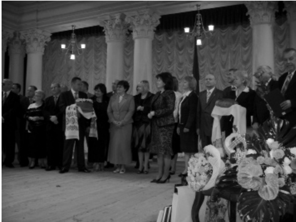
Директори державних архівних установ приймають вітання з нагоди 90-річчя створення архівної системи України. Київ, 14 вересня 2007 р.

90-річчя архівних установ України. До складу оргкомітету ввійшли, зокрема, тодішні Міністр культури і туризму України Ю. П. Богущий, перший заступник голови Секретаріату Президента України І. В. Васюник, перший заступник Міністра закордонних справ України В. С. Огризко, директор Інституту історії України НАН України В. А. Смолій, Голова Держкомархіву України О. П. Гінзбург та інші відповідальні особи. Конкретні завдання щодо підготовки до святкування містилися в наказі Держкомархіву від 18 липня 2007 р. № 107.