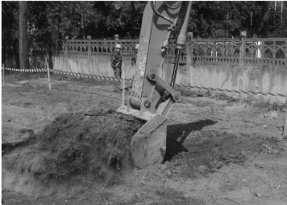
Екскатор виймає перший ківш землі на місці фундаменту майбутньої будівлі. 22 серпня 2007 р.