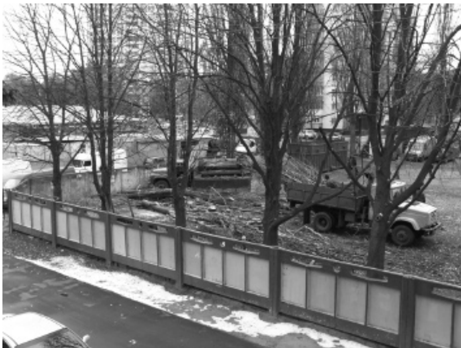
Підготовка майданчика під будівництво нового корпусу комплексу центральних державних архівів України. Київ, листопад 2007 р.