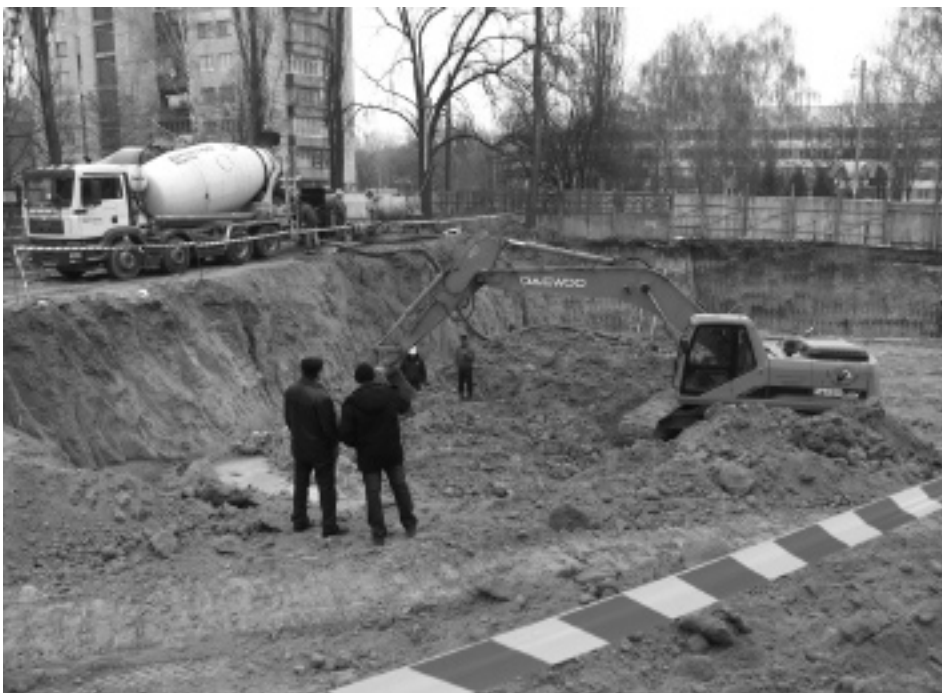
Загальний вигляд котловану під фундамент першого корпусу. Грудень 2007 р.