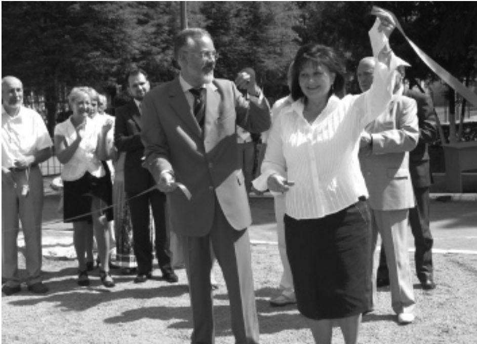
Віце-прем'єр-міністр України Д. В. Табачник разом із Головою Держкомархіву О. П. Гінзбург перерізують стрічку перед будівельним майданчиком. 22 серпня 2007 р.