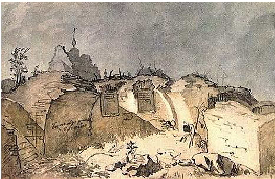
Тарас Шевченко. Богданові руїни в Суботіві. Акварель. 1845

За руїнами, на другому плані, височить силует церкви Богдана Хмельницького. Неподалік – могутнє дерево, що вистояло перед вітрами історії і вірогідно було ровесником цієї церкви та свідком козацького життя, що колись тут вирувало. Простір на цій акварелі побудовано як контраст світлотіней. На світлоносні Богданові руїни з півночі насуваються чорні густі хмари. Шевченко відтворює акти безконечної драми неба. Борються, наступають один на одного пухнасті велетні купчастих хмар, намагаються затьмарити, заповнити собою світлий простір над Богдановою церквою і зруйнованим льохом. Тональність твору оптимістична: зруйновано лише льох, а церква і дерево вистояли, збереглись. Дух і життя народу збереглися, а це запурука його світлого майбутнього.