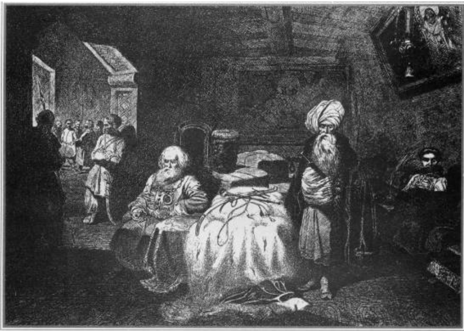
«Дари в Чигирині. 1649 року»

актові підписання Союзного договору між Україною і Росією – державами двох братніх народів. Психологію кожного з послів художник відтворив чітко й умотивовано. Він підштовхує глядача вгадати наперед хід подальших подій. На передньому плані – два послы двох могутніх на той час держав – Росії і Туреччини, за ними в кутку сидить посол польського короля. Турецький посол, сухорлявий, тонконогий старий у високій білій чалмі, явно схвильований: він стоїть, поглинутий думкою про те, як рішення козацької ради позначиться на долі його держави. Поза і обличчя польського посла виражають цілковиту безнадійність. Натомість у постаті боярина – посла російського відчуваються глибока свідомість своєї державної значущості й упевненість в успішному завершенні його дипломатичної місії. Наскрізна ідея офорта полягає в рішенні козацької ради єднатись з одновірним братнім російським народом.