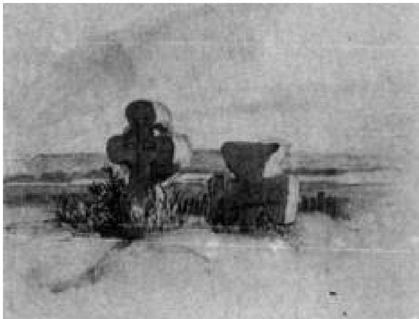
Тарас Шевченко. В Суботіві. Акварель. 1845

наміченого, сповненого повітря пейзажу-річки, яка спокійно тече в далечині, ці хрести здаються ще важчими.