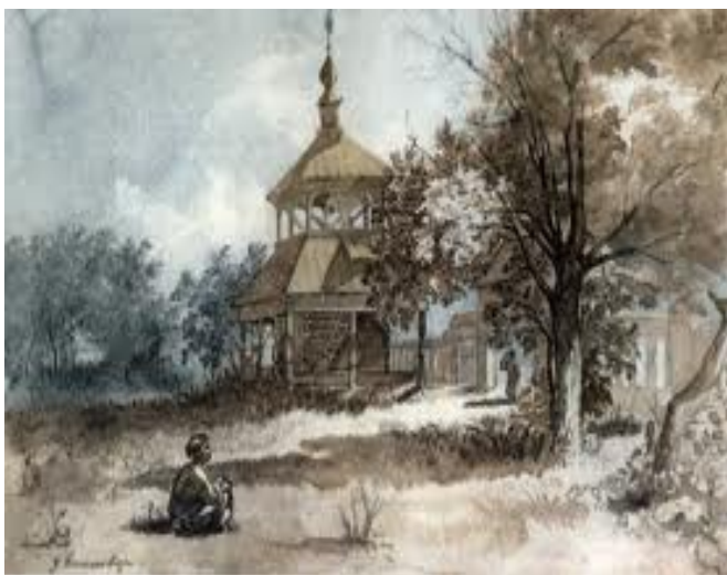
Т. Шевченко. У Василівці. Акварель

Щодо акварелі «У Василівці», то на ній чітко відтворено контраст між красою пейзажу і спотвореністю життя кріпака. Дійсно пейзаж із садом «У Василівці» сповнений сонця і повітря. Яскраво освітлені дерева кидають густі тіні на соковиту траву. А в центрі цього казкового краєвиду – оригінальна пам'ятка народної дерев'яної архітектури: старовинна триярусна дзвіниця з шатровою покрівлею і характерним опасанням на різьблених стовпах. Так прочитав малюнок «У Василівці» Л. Владич, і це не викликає заперечень. Проте прочитання, бо поза увагою цього дослідника залишився жебрак, що сидить на траві навпроти вхідної брами в маєток. Посередині брами – дворовий слуга, котрий проганяє жебрака. Природний контраст світла і тіні художник наклав на соціальний контраст добра і зла, багатства й убогості.