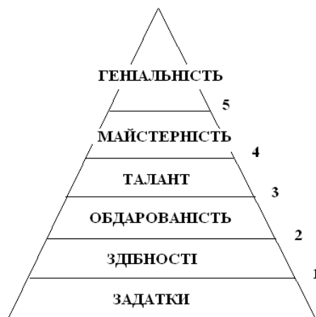
Рис. Етапи розвитку здібностей особистості

Тобто на переході від першої до другої сходинки важливу роль відіграє емоційний складник – це вдовolenня від виконуваної діяльності, інтерес та заохочення з боку значущих осіб. При цьому останнє не головне, хоча є умовою створення позитивного соціального клімату для розвитку здібностей.