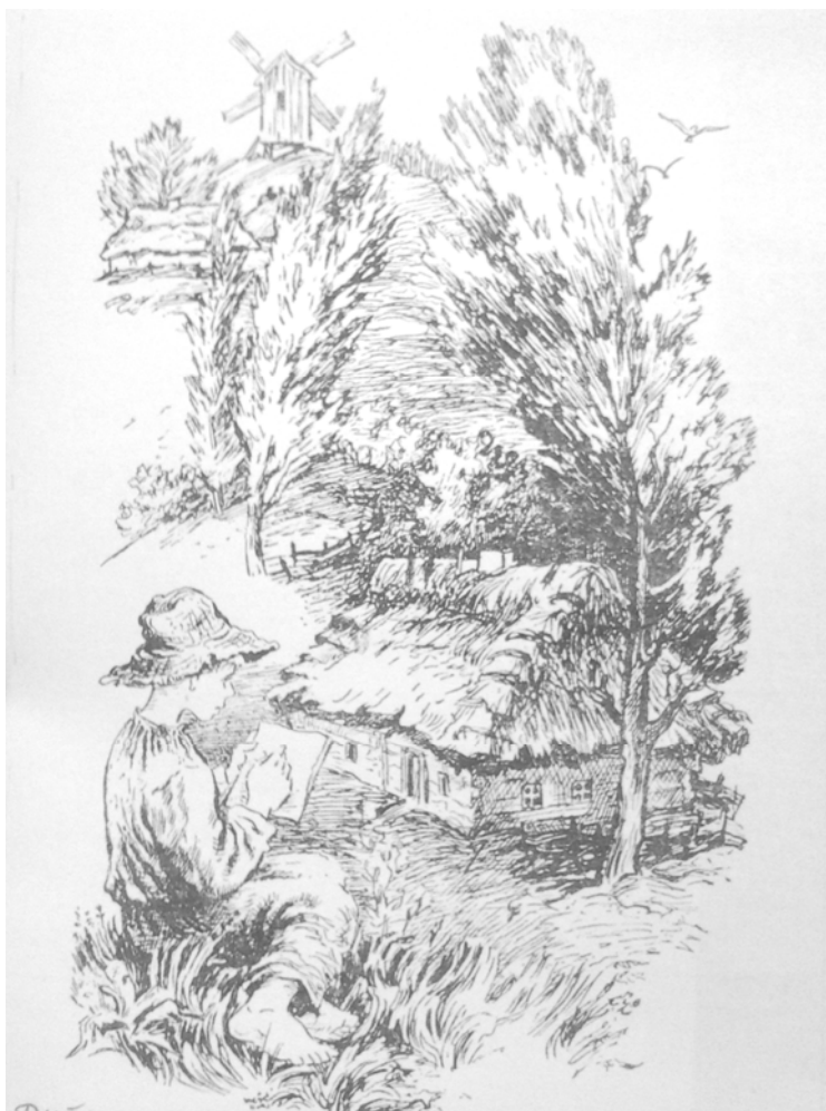
Дитинство Тараса Шевченка за повістю С. Васильченка «В бур'янах». Художник Л.В. Ільчинська

Промовистими в цьому плані є його слова: «Дякую Тобі, всемогутній Боже, що Ти обдарував мене почуттям людини, яка любить і бачить (усе) прекрасне й довершене у Твоїм нерукотворнім безконечнім творінні. Якби краса в усіх її проявах хоч би на половину людства мала добродійний вплив, тоді б ми швидко наближались до досконалості, і нарешті втілили б собою божественну заповідь нашого Божественного Учителя» [3, т.4, с.260].