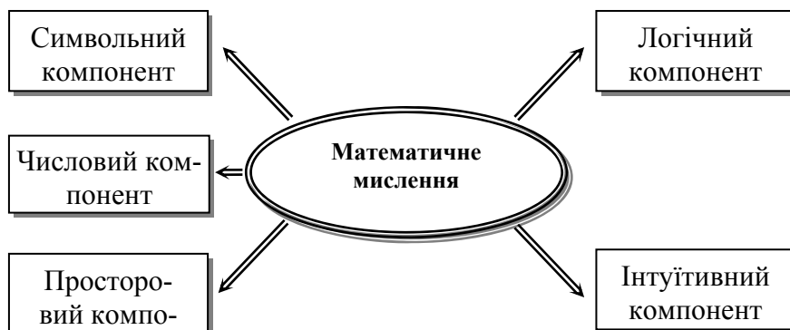
Рис.2. Складові компоненти математичного мислення

совувати такі операції, що в подальшому прислужаться людині в будь-якій мисленнєвій діяльності, в зокрема технічній.