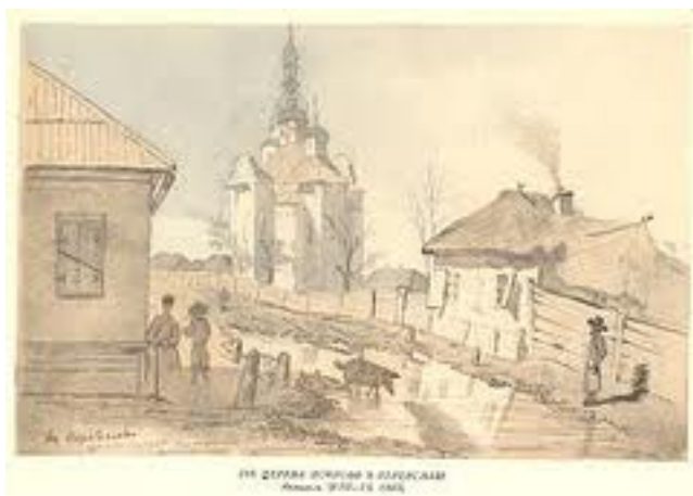
Т. Шевченко. Церква Покрови в Переяславі. Акварель