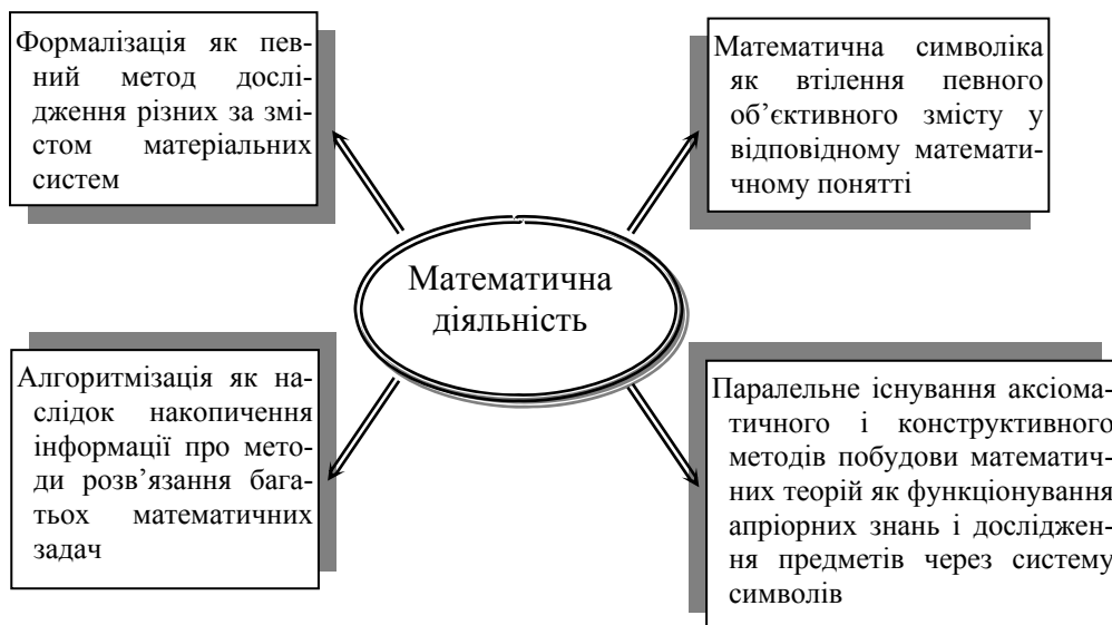
Рис.1. Основні особливості математичної діяльності

гальнення досвіду, а система уявлень, що відносяться до форми знання, яка передує досвідові і має принципово інше джерело свого походження. Вихідні математичні ідеалізації відрізняються від фізичних абстракцій лише тим, що вони відносяться не до світу досвіду, а до світу відношень, що проявляються через діяльність. Вони відображають категоріальні підрозділи і мають ніяк не менший стосунок до реальності, ніж закони фізики [2]. Це дає підстави вичленити основні особливості математичної діяльності (рис.1).