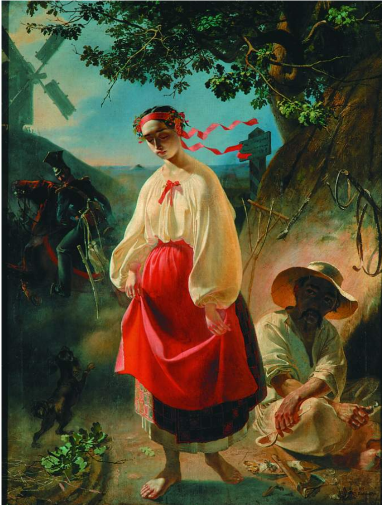
Катерина. 1842. [С.-Петербург] Полотно, олія

лочка дуба – відірваність від роду; зламаний колосок пшениці – знівечена доля людська.