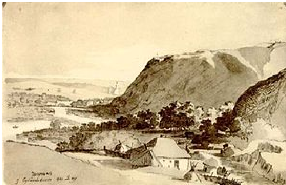
«Чигрин з Суботівського шляху»

До циклу суботівських зарисовок примикають акварелі, які Кобзар виконав у Переяславі – місті, де народився Б. Хмельницький і де 6 січня 1654 року відбулася історична Переяславська рада. Свої враження від побаченого в цьому місті художник висловив у своїх російських повістях, вірші «Сон» («Гори мої високі») (т.2, с.24) та листах (т.6, с.69), а також передав на акварелях. У Переяславі Шевченко змалював аквареллю Вознесенський собор «прекрасной, грациозной, полурукоко, полувизантійской архітектури, воздвигнутый анафемой, Іваном Мазепою, в 1690 году». Тут, крім цього собору, він увіковічив на своїх акварелях і церкви Покрови і Михайлівську церкву.