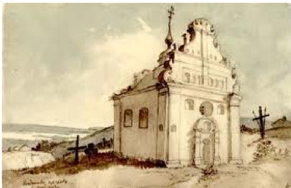
Тарас Шевченко. Богданова церква в Суботіві. Акварель. 1845

і світле в історії людства відбувалось на горі. Згадаймо хоча б гору Сіон та Нагірну проповідь Христа. І далі – західний фасад церкви яскраво освітлений і передає нам відчуття життєдайної теплоти, неначе материнського серця та батьківського піклування. Це Шевченкова душа покривала Суботів і всю Україну світлом любові та високих помислів. Цей фасад, прикрашений могутніми пілястрами й примхливим різьбленим фронтоном, створює виразний контраст із затіненим бічним фасадом. Неперевершений майстер світлотіні зумів виявити характерні об'єми будівлі, її рельєфне оздоблення, а водночас і надати малюнкові особливого настрою. Кам'яні і дерев'яні хрести навколо церкви похилені, по під стінами виріс бур'ян. Усе це посилює відчуття нашої героїчної давнини в цьому історичному краєвиді.