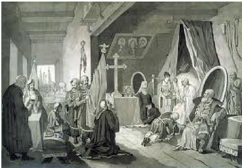
«Смерть Богдана Хмельницького»

1837 роках. Авторіві було тоді ймовірно 23 роки. Не міг він знати, що це полудень його життя.