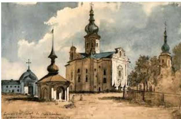
Т. Шевченко. Вознесенський собор у Переяславі. Акварель