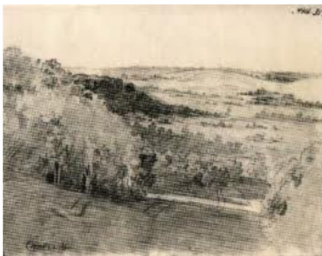
Урочище Стінка. Олівець. 1845

Щодо акварелі «У Василівці», то на ній чітко відтворено контраст між красою пейзажу і спотвореністю життя кріпака. Дійсно пейзаж із садом «У Василівці» сповнений сонця і повітря. Яскраво освітлені дерева кидають густі тіні на соковиту траву. А в центрі цього казкового краєвиду – оригінальна пам'ятка народної дерев'яної архітектури: старовинна триярусна дзвіниця з шатровою покрівлею і характерним опасанням на різьблених стовпах. Так прочитав малюнок «У Василівці» Л. Владич, і це не викликає заперечень. Проте прочитання, бо поза увагою цього дослідника залишився жебрак, що сидить на траві навпроти вхідної брами в маєток. Посередині брами – дворовий слуга, котрий проганяє жебрака. Природний контраст світла і тіні художник наклав на соціальний контраст добра і зла, багатства й убогості.