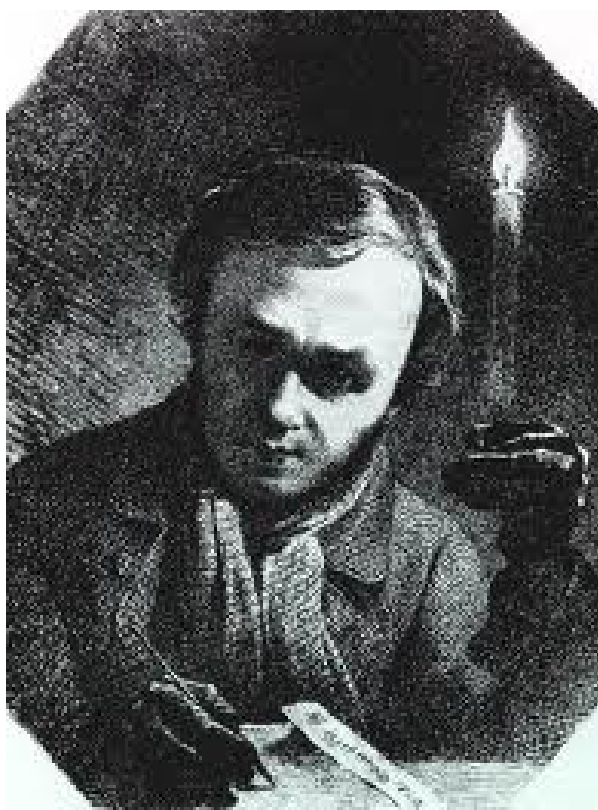
Т. Г. Шевченко. Автопортрет 1840 р.

Пройнятий ідеєю свободи і національної гідності, Шевченко продовжує освітлювати і відтворювати в національній пам'яті народу героїку його національно-визвольної боротьби 1648-1654 років, а згодом і гайдамацького руху. Будучи ще учнем Петербурзької академії мистецтв, Шевченко в 1843 році задумав художнє періодичне видання «Живописна Україна». Воно мало виходити окремими випусками, по три естампи в кожному, чотири рази на рік. Раз на рік мали видавати пояснювальний текст до річного комплекту. В «Живописній Україні» Шевченко в різних жанрах образотворчого мистецтва – в історичних і жанрових картинах, історичних, архітектурних і ліричних пейзажах показував минуле і сучасне свого народу, мальовничу природу України, історичну долю народу, його волелюбність і героїчну боротьбу проти гнобителів, розповідав про його життя і побут. Проте йому не вдалося повністю здійснити свій патріотичний задум. Перешкодили цьому його арешт у травні 1847 року і заслання із забороною писати і малювати. Наприкінці 1844-го вийшли лише перші два випуски видання, які містять офорти «Дари в Чигрині 1649 року», «Старости», «Судня рада», «Казка», «У Києві» та «Видубицький монастир у Києві». Зміст цих творів у своїх працях проаналізували Л. Владич, В. Косіян, О. Новицький, Д. Степовик і З. Тарахан-Берега.