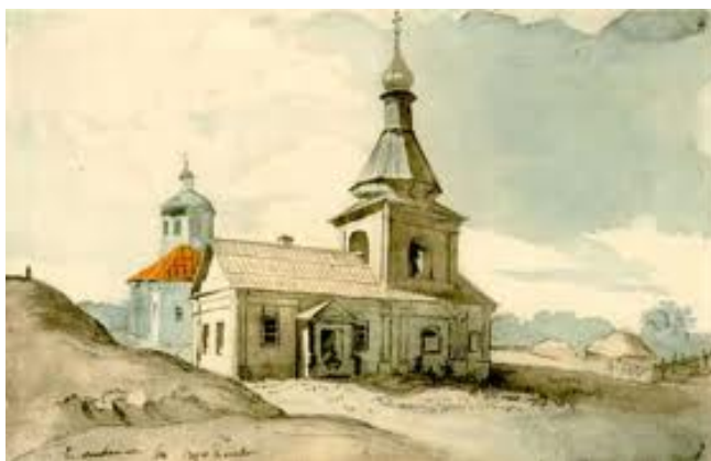
Т. Шевченко. Михайлівська церква. Акварель.

Вищепроаналізовані акварелі безпосередньо пов'язані з проектом Шевченкового видання «Живописної України». Крім них, художник у 1845-1847 роках виконав, як автор цього видання і як співробітник Київської археологічної комісії багато інших творів не тільки з архітектурними пейзажами, а й краєвидами пам'ятних місць, пов'язаних з іменами видатних діячів російської та української культури. Насамперед ми маємо на увазі Шевченкові акварелі 1845 року, намальовані з натури в мастку Гоголів-Яновських у с. Василівці-Яновщині (тепер с. Гоголеве Полтавської області). Це акварель «Урочище Стінка» (Олівець. 1845) і «Урочище Білик» (Олівець. 1845). У цих творах відображено мальовничі пейзажі неповторної краси.