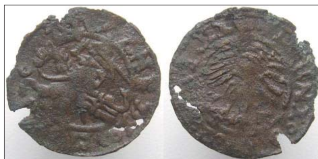
Рис. 2. Фальшивий півгрош Олександра Ягеллона, мідь

Серед фальшивих півгрошів Олександра I Ягеллона нам вдалося дослідити один екземпляр фальшивого півгроша, виготовленого із міді, знайденого в околицях міста Володимир-Волинського (рис. 2). Основу фальсифікату виготовлено з міді, шар дорогоцінного металу не зберігся. Виходячи з візуального аналізу елементів зображення фальшивого півгроша можна дійти висновку, що його виготовили шляхом карбування по мідній заготовці влас-