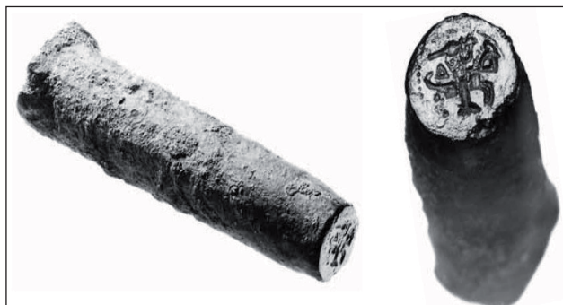
Рис. 1. Штемпель для карбування фальшивого денарія Олександра Ягеллона, знайдений у Литві

1992 р. при дослідженні зовнішнього двору південного корпусу Князівського палацу знайдено верхній штемпель (рис. 1).