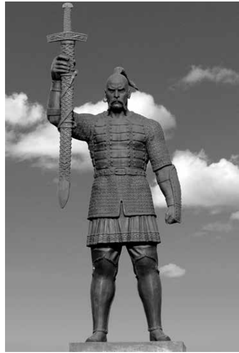
В. Кликов. Пам'ятник князю Святославу у м. Запоріжжі (2005)

15 жовтня 2005 р. під час святкування Дня міста на березі Дніпра проти острова Хортиця у Вознесенському парку Запоріжжя урочисто відкрито пам'ятник князю Святославу Хороброму роботи талановитого російського скульптора Вячеслава Кликова.