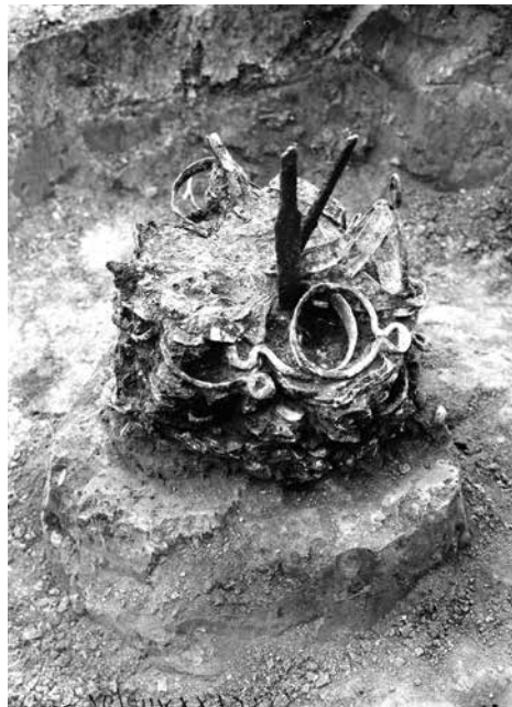
Вознесенський скарб. Фото 1930 р. із звіту В. Грінченка