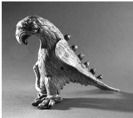
Срібне навершя у вигляді орла з Вознесенського скарбу. Запорізький краєзнавчий музей. Фото 2012 р.

Робота М. Міллера вкрай цікава і актуальна загальною характеристикою досліджень Дніпрогесівської археологічної експедиції і їх подальшою долею. Автор констатував, що її величезні археологічні, історичні та етнографічні матеріали через несприятливі умови для наукової праці в УРСР не були належно оцінені і використані, а в багатьох випадках забуті або ж загинули. М. Міллер заявив наступне: “У зв'язку з таким станом речей, вважаю себе зобов'язаним оголосити хоча б згадками, хоча б у самих коротких рисах одну з надзвичайних знахідок, зроблених експедицією. ... Маю на увазі знахідку, яка серед робітників експедиції отримала умовну назву “Кічкаський скарб” 6 .