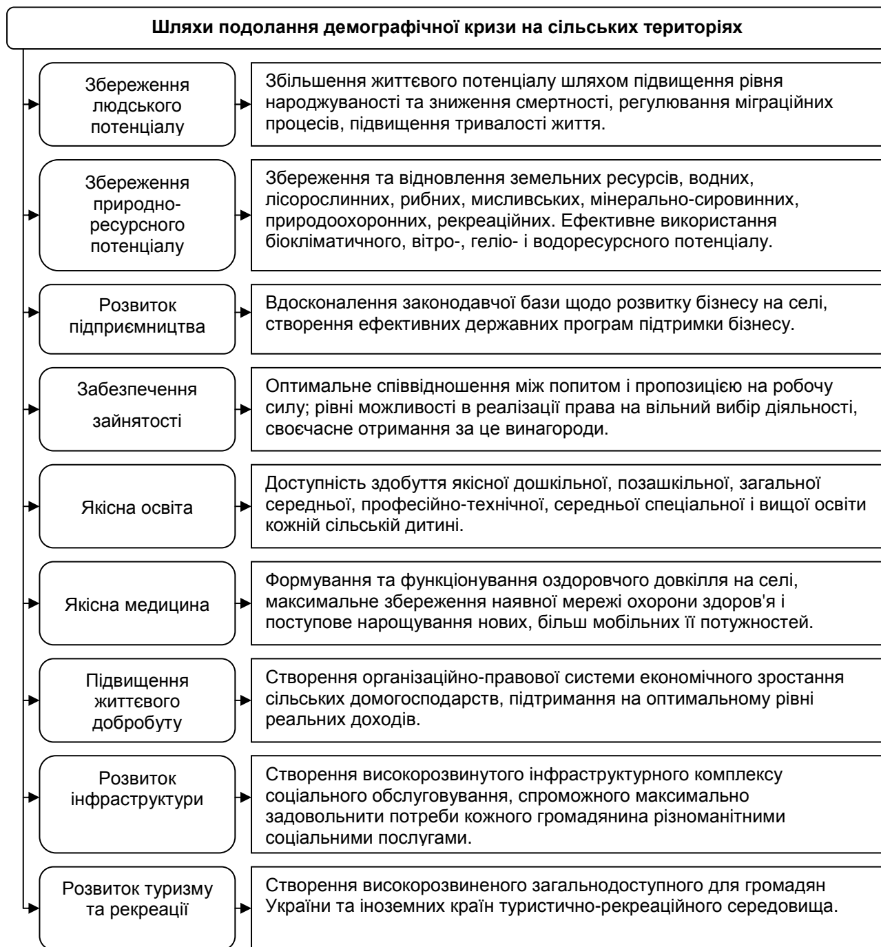
Рис. 3. Шляхи подолання демографічної кризи на сільських територіях

Розв'язання демографічної кризи, забезпечення сталого демографічного розвитку та нормалізація відтворення населення є довготривалим і складним процесом. Слід розуміти, що зміст реального виходу з демографічної кризи полягає не стільки в подоланні депопуляції, скільки у підвищенні якісної структури народонаселення, збереженні та відтворенні його життєвого і трудового потенціалу [3, с. 165].