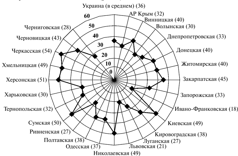
Рис. 1. Территориальные отличия охвата детей сельскими дошкольными учебными заведениями (%)

В региональном разрезе наблюдаются значительные отличия. Например, если в 2011 г. в целом по Украине в сельской местности дошкольными заведениями было охвачено 36% детей, то в Черкасской области этот показатель равнялся 54%, а в Ивано-Франковской — только 18% (рис. 1).