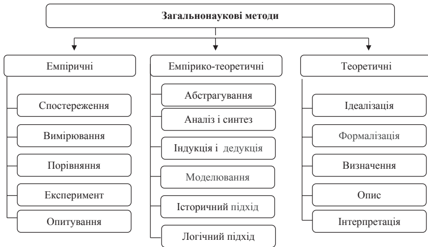
Рис. 1. Загальнонаукові методи пізнання