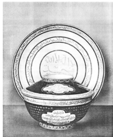
Тажин і таця-ляган. Експериментальний експортний товар Баранівського ф/з на східний ринок, 1960-ті.

– Ташкентський фарфоровий завод (м. Ташкент, Узбекська РСР);