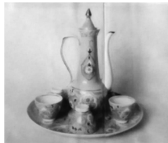
Багіров. Набор для целебных трав, Кіровоградський фарфоровий завод, 1985

виробництв добре простежується за виданням І. та С. Насонових, «якість» звершень на цих підприємствах документується за допомогою саме альбомів ВІА «Легпрому». За даними цієї, другої групи першоджерел, випливає наступна хронологія. 1963 року почав досягати результатів Ташкентський фарфоровий завод (заснований 1952-го). На 1969 рік розробляв окреслений сегмент російський підмосковний стародавній Кузяєвський фарфоровий завод, а також Бакінський завод фаянсового посуду (діяв з 1957-го), котрий від 1974 р. переіменовано у Бакінський фаянсовий завод.