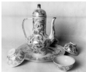
Багіров. Набор для щербета, Кіровоградський фарфоровий завод, 1985