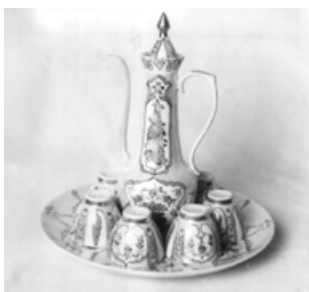
Багіров. Набор для целебных напитков, Кіровоградський фарфоровий завод, 1985