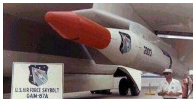
Рис. 2. ОТР GAM-87A Skybolt

В 1961 р були проведені випробування зразків двоступеневої аеробалістичної оперативно-тактичної ракети GAM-87A Skybolt (рис. 2) масою 5 т і дальністю 1850 км, однак на озброєння вони не надійшли з політичних міркувань [4].