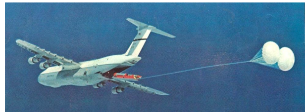
Рис. 1. Повітряний старт МБР

ний перший експериментальний запуск МБР «Мінітмен-1» (рис. 1) [3]. Випробування підтвердили технічну можливість реалізації безпечного старту МБР масою 31,8 т з військово-транспортного літака типу С-5А методом парашутного десантування через хвостовий люк. В результаті забезпечувалася можливість створення ракетного комплексу з МБР повітряного старту на базі існуючих військово-транспортних літаків в стислі терміни і з мінімальним технічним ризиком. При цьому істотно зменшувалися витрати порівняно з варіантами, які передбачали розробку нових спеціалізованих літаків-носіїв [3].