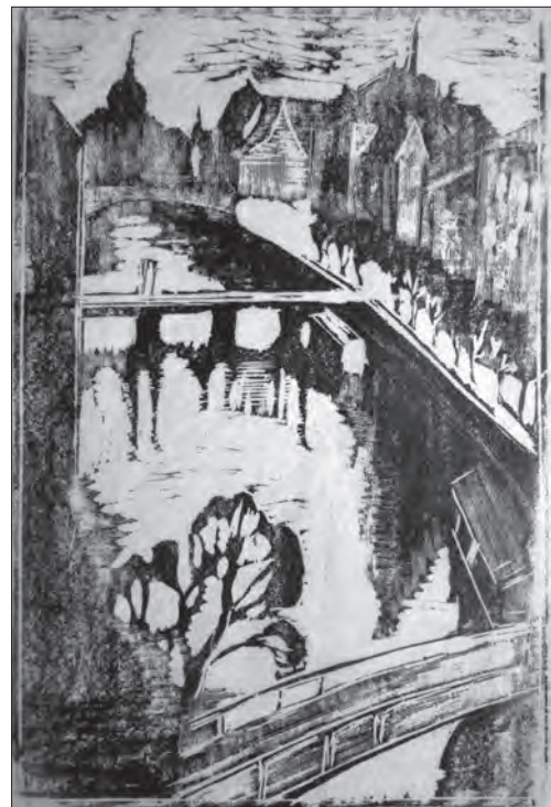
Творча робота Олени Кульчицької — «Види Перемишля» (папір, дереворит). — Ф. 140. — Чех. 112. Відбитки відкриток, взірці вишивок, карти районів та різні чорнові зарисовки, 50—60 рр. XX ст. — 800 арк. Публікується вперше