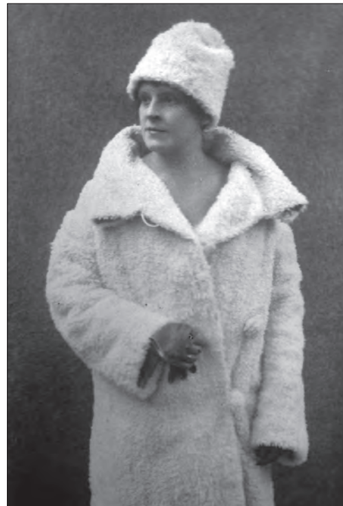
Фото С.В. Чехович; 1920—30-ті рр. — Ф. 140. — Чех. 108. Фотографії С.В. Чехович з різних років життя, 1906, 1967. — 16 арк. Публікується вперше