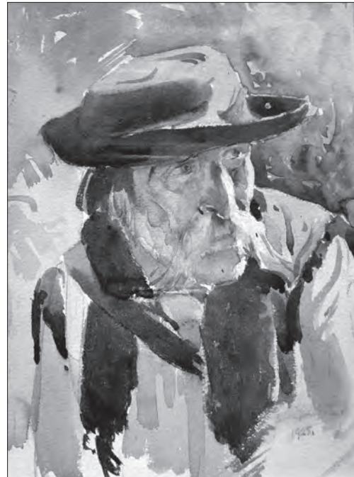
Творча робота Софії Чехович — «Портрет старого гуцула», 1925 р. (папір, акварель). — Ф. 140. — Чех. 122. Художні портретні роботи С.В. Чехович, 1923, 1925. — 4 арк. Публікується вперше

ISSN 1028-5091. Народознавчі зошити. № 3 (105), 2012