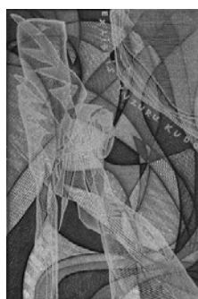
«Серебряный ангел». Экслибрис Ю. Кудо, Цветная ксилография, 1999 г.