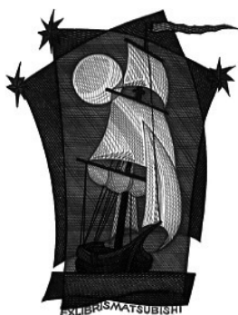
«Парусник». Экслибрис Мацубиши, Цветная ксилография, 2001 г.