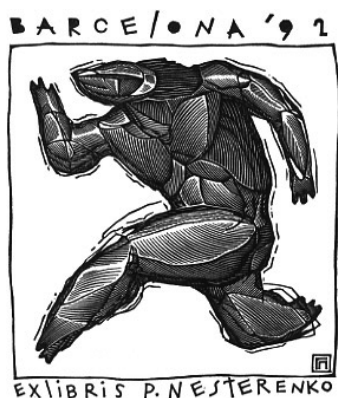
«Олимпийские игры в Барселоне». Экслибрис П. Нестеренко, Ксилография, 1992 г.