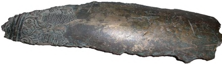
Рис. 2. Уламок дула гармати XVII – початку XVIII ст. в експозиції музею археології Батуріна НКЗ «Гетьманська столиця».

Базовим елементом матеріальної частини війська було забезпечення його порохом. Виготовленням його займалися майстри порохівники. Як зазначає дослідник Б. Онопрієнко, порох виготовляли при селітроварних заводах. Центрами селітроваріння в Україні були Миргород, Полтавщина, Київщина, Путивль (Онопрієнко, 1864: 792). Для приготування пороху необхідні були 3 елементи: селітра, деревне вугілля та сірка. Вугілля для гармат випалювали з ліщини, верби, липи; рушничний порох потребував вугілля з вільхи та черемхи, мисливський – з конопель.