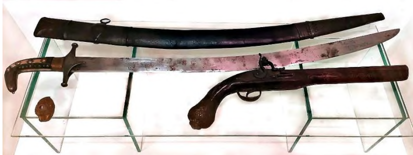
Рис. 1. Шабля з піхвами, пістоль в експозиції музею археології Батурина НІКЗ «Гетьманська столиця», XVIII ст.