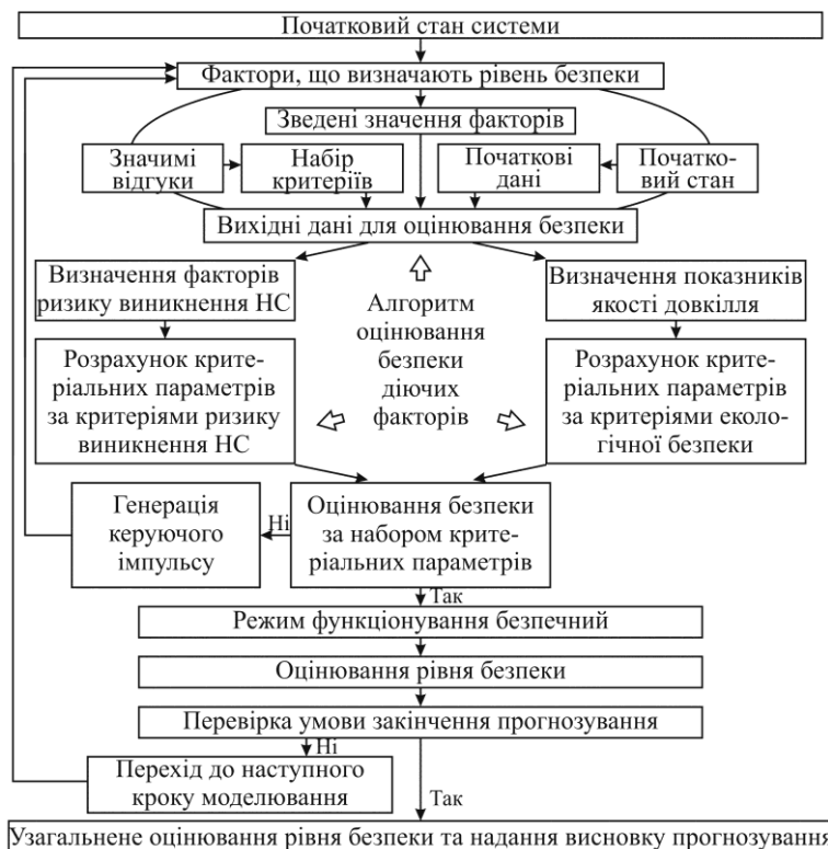
Рис. 2 – Спрощена схема методу прогнозування рівня безпеки полігону зі зберігання ТПВ

Оскільки реальні умови функціонування природних процесів у навколишньому природному середовищі характеризуються впливом складного комплексу негативних факторів, оцінювання результату їхньої дії має базуватися на сформованих динамічних моделях виникнення відгуків навколишнього середовища під дією тих або інших факторів. З урахуванням цього метод прогнозування рівня безпеки полігону зі зберігання ТПВ полягає у покроковій перевірці дотримання умов безпечного функціонування об'єкту на основі критеріїв безпеки у n -вимірному просторі факторів F_i \in \Phi , i = 1 \dots n , де n – кількість факторів у сукупності, які змінюються за програмою функціонування об'єкту, з наданням узагальненого висновку про рівень безпеки. Спрощену схему методу подано на рис. 2.