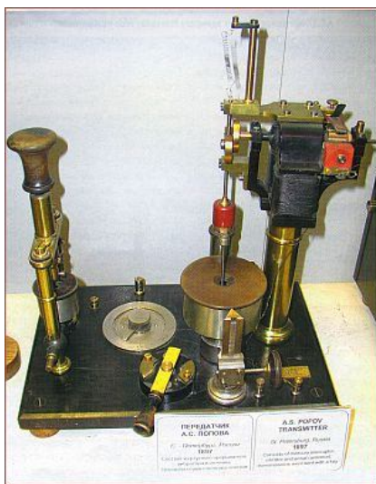
Рис. 3. Загальний вигляд передавача Попова

23 квітня 1895 р. на засіданні Російського фізико-хімічного суспільства О.С. Попов продемонстрував свій апарат, що є родоначальником всіх прийомних приладів іскрової "бездротової телеграфії" (рис. 3). У 1895-1896 р. вчений удосконалював свій передавальний пристрій. У 1896 р. був організований прийом першої у світі радіограми у фізичному кабінеті Петербурзького університету на Василівському острові. Станція відправлення перебувала на відстані 250 м, у Хімічному інституті. До прийомного пристрою був під'єднаний телеграфний апарат, що передавав за алфавітом Морзе одну букву за іншою. Текст цієї телеграми говорив: "Генріх Герц".