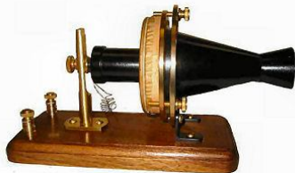
Рис. 2. Загальний вигляд телефону Белла

Подальша розробка телефону пов'язана з іменами американських винахідників І. Грея і А.Г. Белла [5]. 14 лютого 1876 р. вони зробили заявку на телефонні апарати, що могли практично використовуватися. Оскільки заявка Грея була зроблена на 2 години пізніше, патент був виданий Беллу, а ініційований Греєм процес проти Белла був їм програний. Телефон, запатентований у США в 1876 році Олександром Беллом, називався "мовлячий телеграф" (рис. 2). Трубка Белла працювала по черзі і для передачі, і для прийому людської мови. У телефоні Белла не було дзвінка, пізніше він був винайдений колегою А. Белла – Т. Ватсоном (1878 р.). Виклик абонента проводився через трубку за допомогою свистка. Дальність дії цієї лінії не перевищувала 500 метрів.