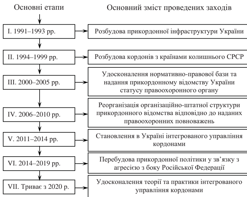
Рис. 1. Основні етапи розвитку прикордонної політики в Україні

IV. Розпочався із 2006 р. 12 . Вони представлені на рис. 1 .