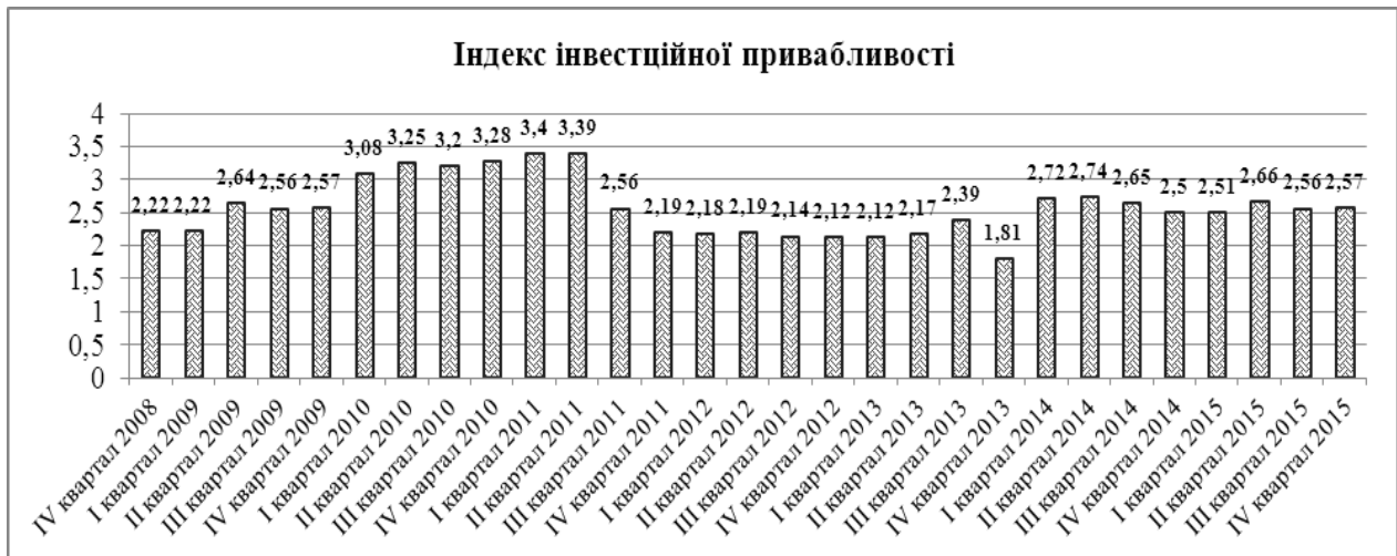
Рис. 2 Динаміка індексу інвестиційної привабливості України [9]

Дослідження демонструє, що переважна більшість – 80 % бізнесменів – незадоволені поточним станом інвестиційного клімату в Україні. У співвідношенні до попередньо одержаного результату Індекс інвестиційної привабливості лишився незмінним – різниця мізерна і становить 0,01 балів. Бізнес-спільнота досить категорично висловила свою думку стосовно позитивних змін: 62 % респондентів відповіли, що взагалі не відчувають жодного позитиву за останні три місяці. 37 % топ-менеджерів вважають, що інвестиційний клімат залишається незмінним і перебуває в негативному значенні протягом усіх попередніх періодів. 8 % опитуваних зазначили серед позитивів – відносну валютну стабільність. І ще 8 % відмітили поліпшення на макрорівні. 49 % опитаних не очікують позитивних змін у найближчій перспективі і переконані, що бізнес-клімат залишиться приблизно на тому ж рівні.