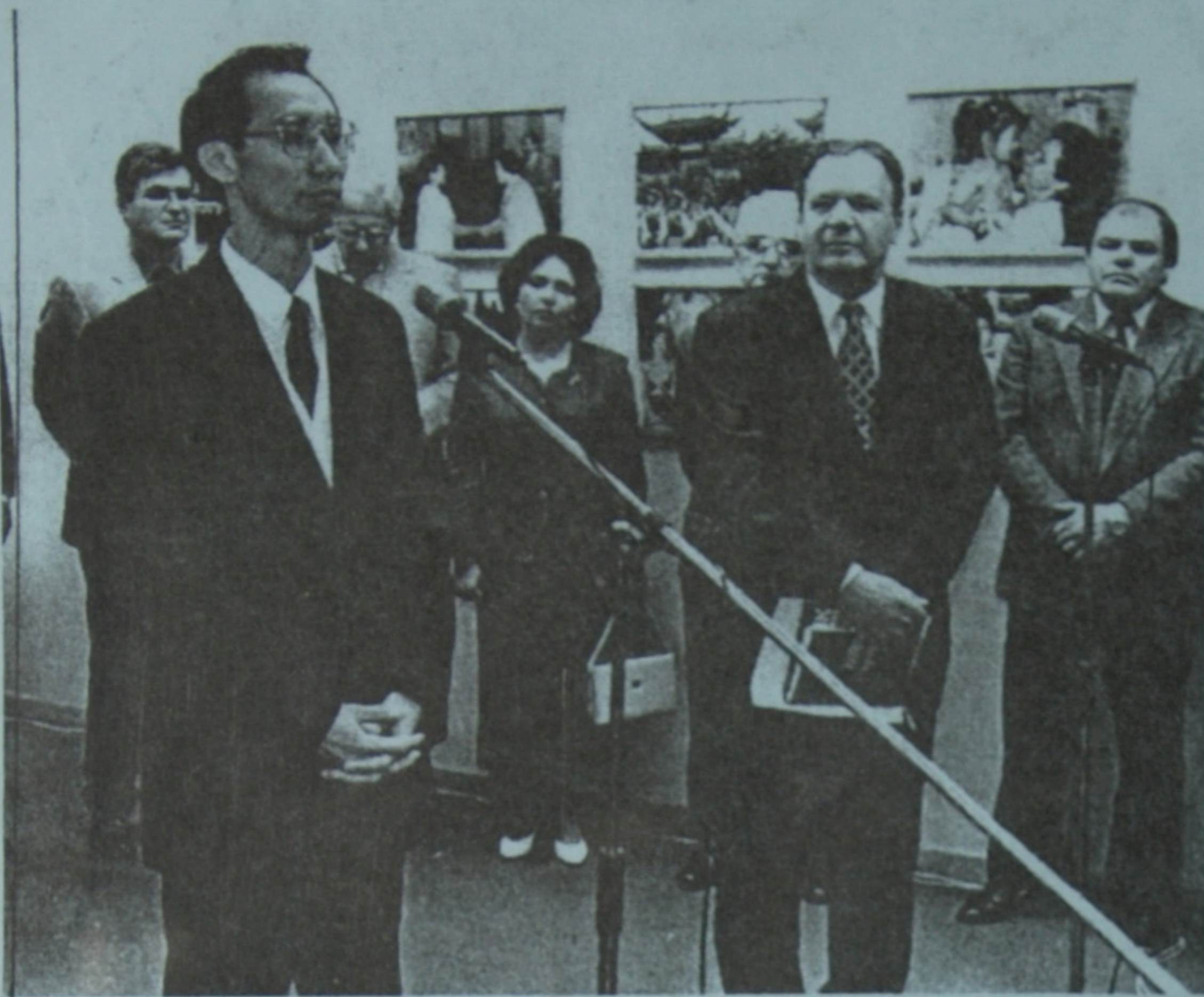
Виступає Надзвичайний і Повноважний Посол Китайської Народної Республіки в Україні пан Чжоу Сяопей

Цього року виповнюється 50 років утворення Китайської Народної Республіки.