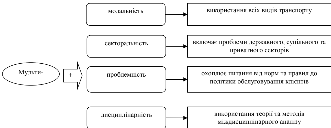
Рис. 1. Ознаки транспортної системи міжнародного змішаного перевезення

Можна підсумувати, що в сучасних умовах термін «міжнародні мультимодальні перевезення» використовується для визначення особливостей організації перевезень та рівня відповідальності перевізника в системі перевезень «від дверей до дверей», тоді як міжнародні змішані перевезення здебільшого передбачають використання автомобільного та залізничного транспорту в інтермодальних перевезеннях [6]. Процес реалізації міжнародних змішаних перевезень передбачає формування транспортної системи, яка має певні ознаки (рис. 1):