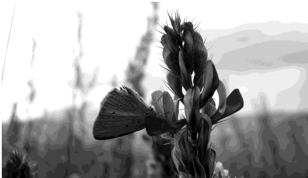
Р и с. 2. Polyommatus (Agrodiaetus) kosarevi Korb, sp. n.: ♀ на кормовом растении гусениц (Кыргызстан, Нарынская обл., окр. с. Оттук, 14.07.2006).