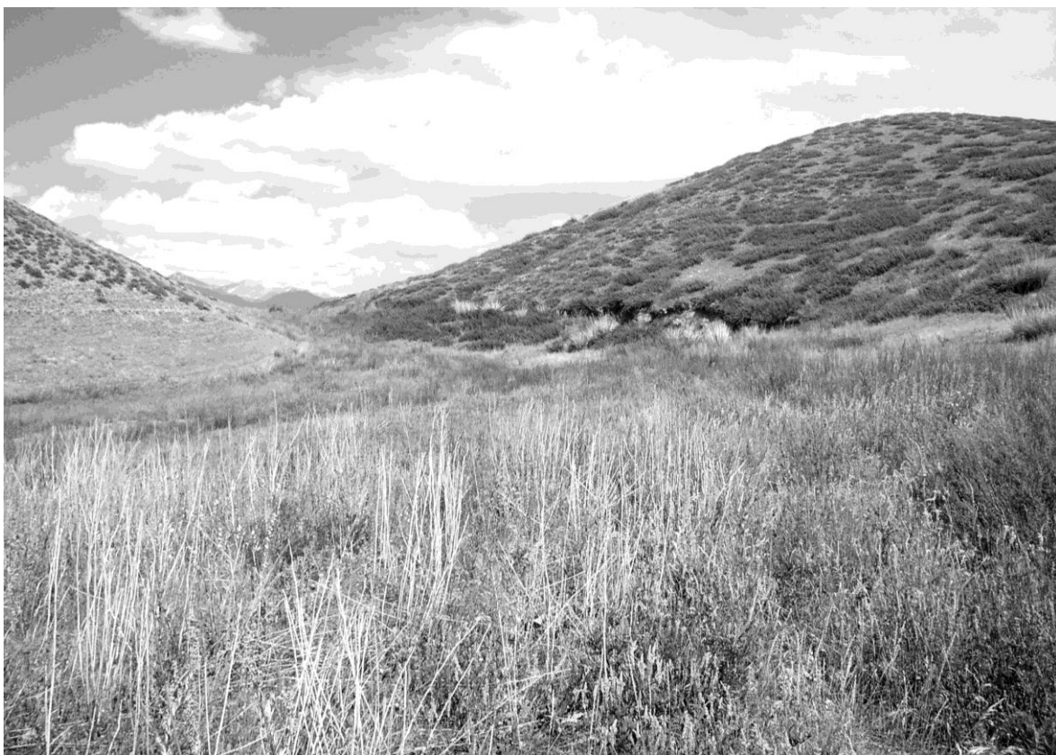
Рис. 4. Биотоп Polyommatus (Agrodiaetus) kosarevi Korb, sp. n. (Кыргызстан, Нарынская обл., окр. с. Оттук, 14.07.2006).