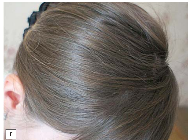
Рис. 5. Пацієнтка Л., 23 роки. Діагноз: мікоз волосистої частини голови, зумовлений Trichophyton rubrum

а, в — до лікування; б, г — після лікування із застосуванням препарату «Фунготек» (клінічний випадок представлений лікарем Н.Ю. Резніченко).