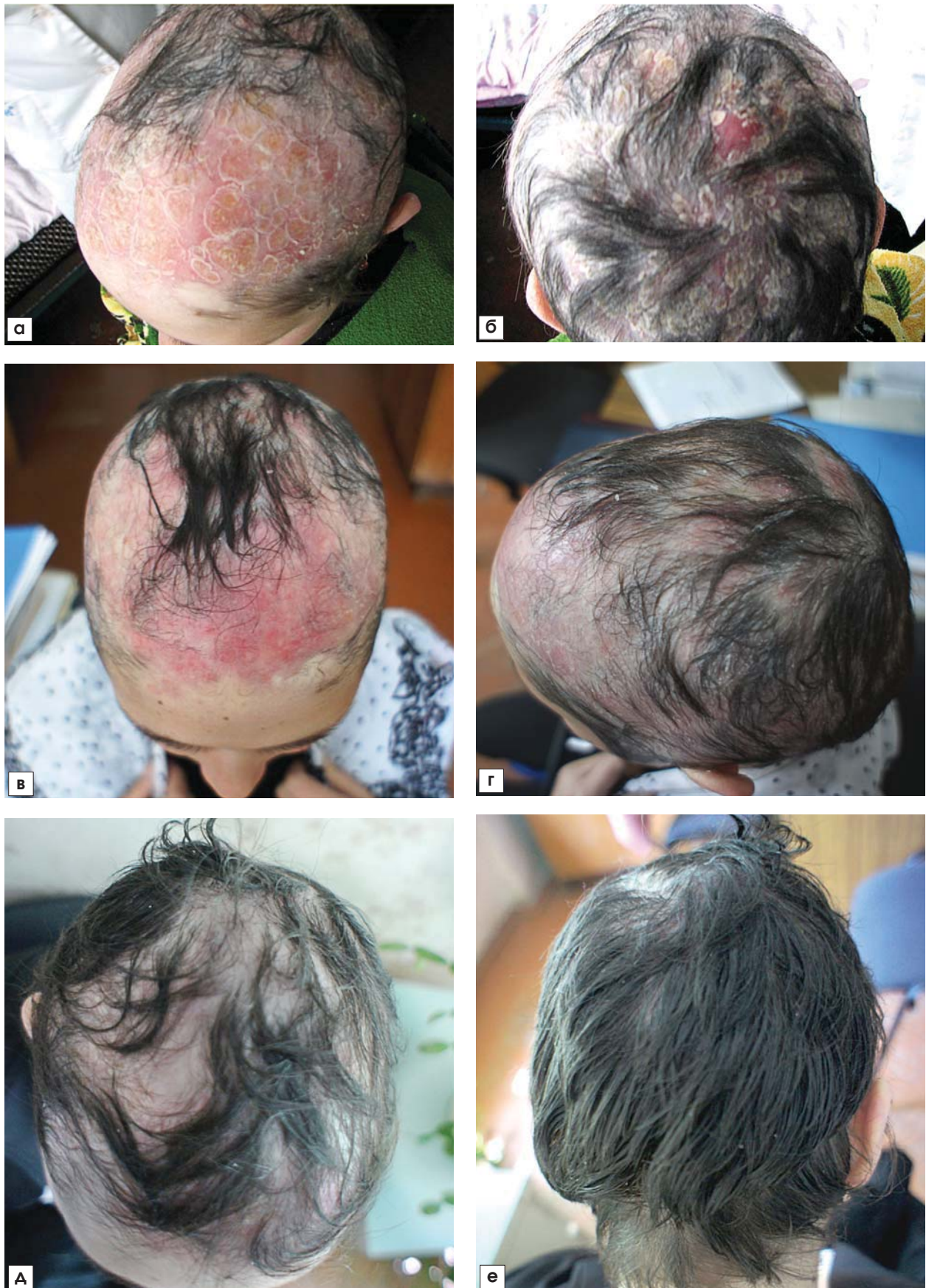
Рис. 6. Хвора Д., 22 роки. Діагноз: мікоз волосистої частини голови, зумовлений Trichophyton mentagrophytes , синдром Швахмана—Даймонда

а, б — до лікування мікозу; в, г — через 2 тиж лікування; д, е — через 4 міс лікування (клінічний випадок представлений лікарем Н.Ю. Резніченко).