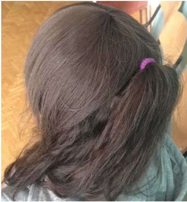
Рис. 7. Хвора Д., 22 роки. Діагноз: мікоз волосистої частини голови, зумовлений Trichophyton mentagrophytes . Синдром Швахмана—Даймонда через 3 роки (клінічний випадок представлений лікарем Н.Ю. Резніченко).

Пацієнтку Л., віком 23 роки (див. рис. 5), включену в наше дослідження, було направлено до жіночого шкірного відділення Запорізького обласного шкірно-венерологічного клінічного диспансеру з попередніми діагнозами: псоріаз волосистої частини голови, трихофітія волосистої частини голови, мікроспорія волосистої частини голови. Під час госпіталізації до стаціонарного відділення пацієнтка скаржилася на почервоніння та лущення шкіри голови, посилене випадіння волосся з формуванням вогнищ облісіння. З анамнезу стало відомо, що вона захворіла 6 міс тому. Пацієнтка зверталася по медичну допомогу до сімейного лікаря за місцем проживання, який спочатку встановив діагноз себореїного дерматиту, а потім — псоріазу волосистої частини голови. З цього приводу хвора отримувала амбулаторне лікування антигістамінними препаратами, вітамінами групи В, гепатопротекторами і топічними кортикостероїдами. Ефекту від лікування не відчувала, а навпаки — спостерігала погіршення стану шкіри голови та прогресування алопеції. З сімейного анамнезу стало відомо, що родичі хворої не страждали на псоріаз та інші дерматози.