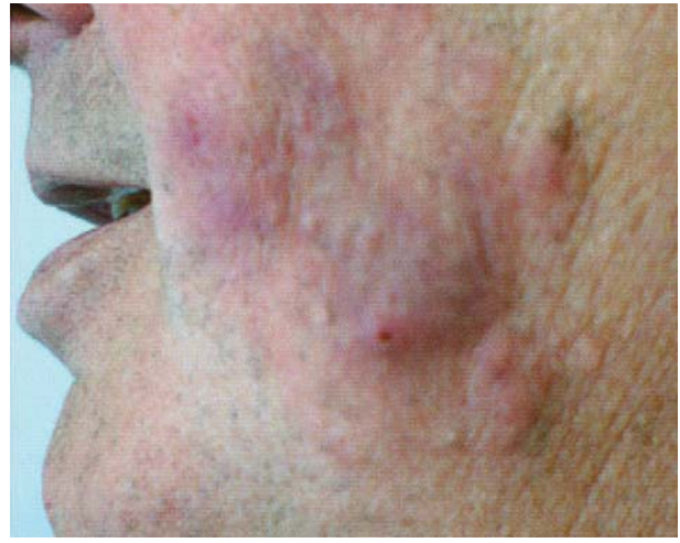
Рис. 4. Пацієнт С., 57 років. Діагноз: паразитарний сікоз, зумовлений інфікуванням Trichophyton verrucosum

Наявність на гладенькій шкірі численних рожевих плям круглої форми з чіткими межами з блідим центром та периферичним обідком, лущенням на поверхні. Під променями лампи Вуда — специфічне яскраве «фосфоричне» світіння зеленим кольором. В анамнезі — щоденний контакт з кошенятами, після чого і виникли висипання. Мати хворої самостійно застосовувала фулорцин для лікування (клінічний випадок представлений лікарем Н.Ю. Резніченко).