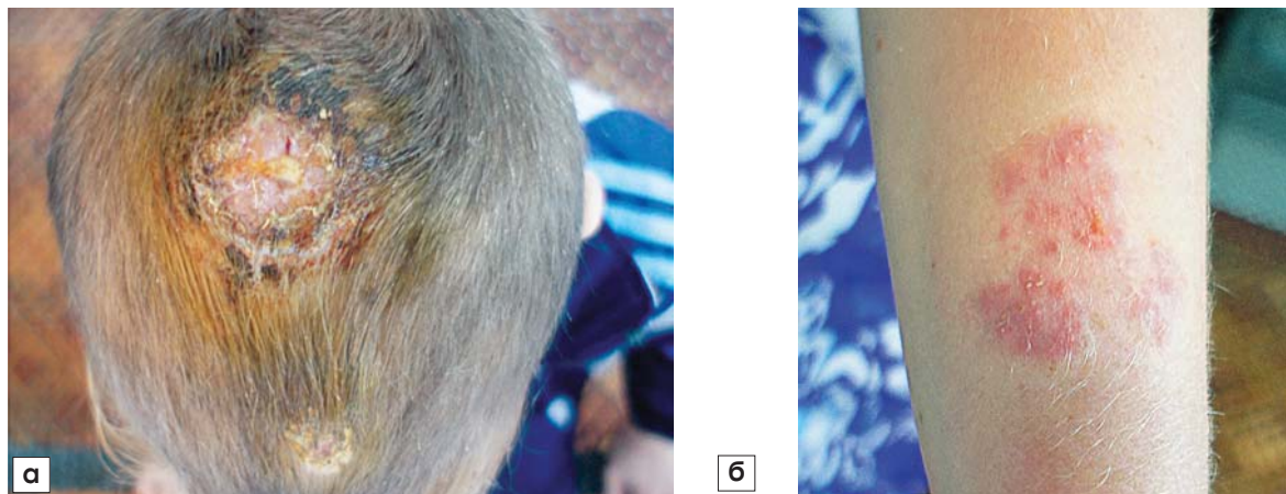
Рис. 2. Діагноз: дерматофітія, зумовлена інфікуванням Trichophyton verrucosum

а — Керіон, у лобній зоні волосистої частини голови — болісний пухлиноподібний інфільтрат, на поверхні якого розташовані численні фолікулярні пустули та кірки жовто-коричневого кольору, в разі стиснення інфільтрату з'являються краплини гною; б — вогнище ураження на шкірі живота (пляма рожевого кольору з чіткими межами та фолікулярними пустулами і лущенням на поверхні). Хвора мешкає у сільській місцевості (клінічний випадок представлений лікарем О.О. Діденко).