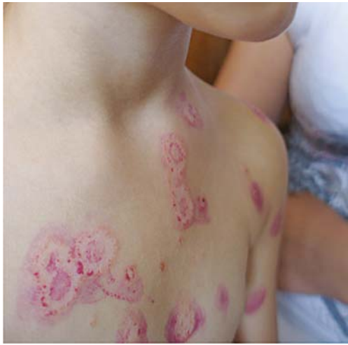
Рис. 3. Пацієнтка Л., 4 роки. Діагноз: дерматофітія, зумовлена інфікуванням Microsporum canis

Наявність на гладенькій шкірі численних рожевих плям круглої форми з чіткими межами з блідим центром та периферичним обідком, лущенням на поверхні. Під променями лампи Вуда — специфічне яскраве «фосфоричне» світіння зеленим кольором. В анамнезі — щоденний контакт з кошенятами, після чого і виникли висипання. Мати хворої самостійно застосовувала фулорцин для лікування (клінічний випадок представлений лікарем Н.Ю. Резніченко).