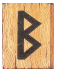
Рисунок 7. Руна Беркана

Також популярною у брендах є літера В, або рунічний знак Беркана (див. Рис. 7). Символічне значення цієї руни: створює «осередок тиші і спокою», відгороджуючи власника від суєти зовнішнього світу; сприяє реалізації планів; вона дуже корисна, коли обмірковується новий проект.