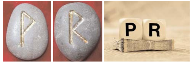
Рисунок 6. Руни Вуньо, Райдо у торговельних марках