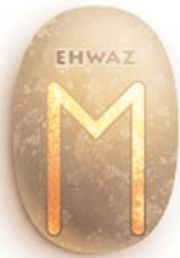
Рисунок 3. Руна Еваз

Найпопулярніша руна у брендах. Сакральний зміст – просування вперед, поступовий розвиток і стійкий прогрес, повільне зростання через послідовні зрушення й зміни.