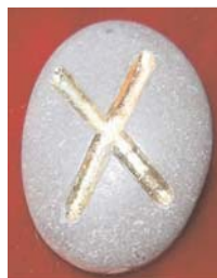
Рисунок 10. Руна Гебо

Висновки. Таким чином, використання рунічних знаків у фірмових знаках відомих брендів є запорукою їх успішного просування на споживчому ринку.