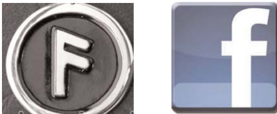
Рисунок 9. Руна спілкування Ансуз та фірмовий знак «Facebook»

Руна партнерства Гебо, або знак «множення» (див. Рис. 10) – сприяє початку партнерського бізнесу, зміцнює налагоджені контакти (див. Рис. 11).