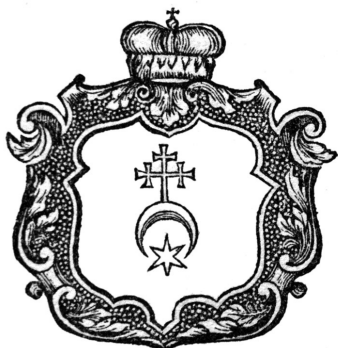
Герб князів Вишнівецьких