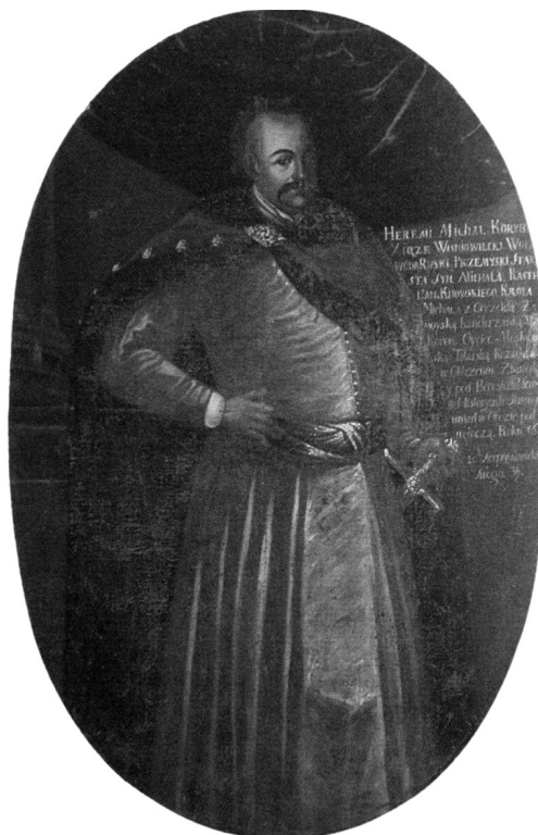
Портрет Михайла Корибута-Вишнівецького. Національний музей історії України