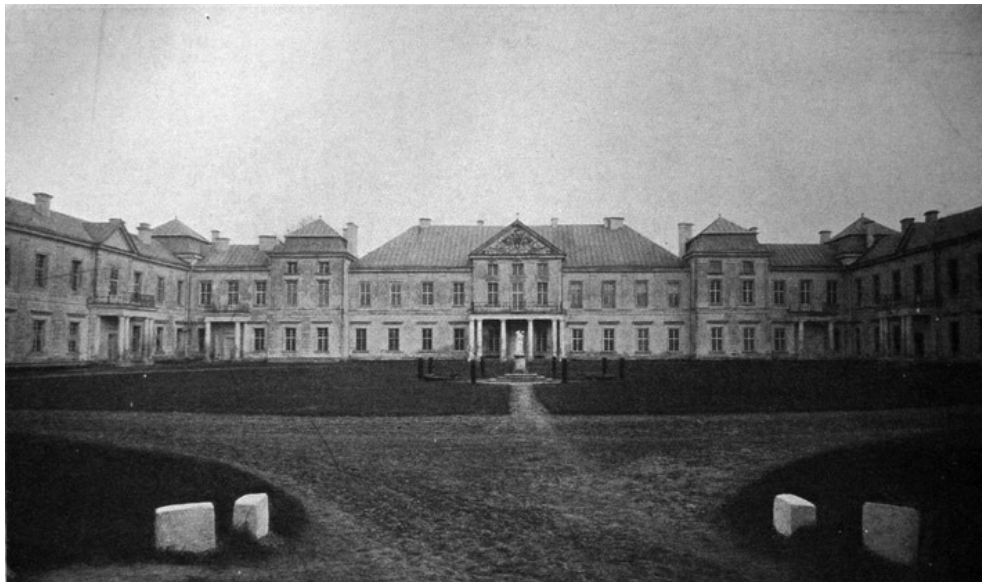
Вишневець. Головний фасад замку

чатку 1639 року Гризельда вже була одружена з Єремією Вишневецьким. 31 травня 1640 р. о другій годині дня у молодого подружжя в Білім Камені народився первісток – Михайло – майбутній король Речі Посполитої [6, с. 249]. Швидко, однак, молодята поїхали до Вишнівця, і родове гніздо князів Вишневецьких стало головною садибою княгині, хоча вона часто подорожувала маєтностями чоловіка. Принаймні двічі – в 1643 і в 1647–1648 рр. – вона також перебувала разом з чоловіком кілька місяців на Задніпрянщині. У 1648 р. вибухнуло повстання козаків під проводом Богдана Хмельницького, і Єремія Вишневецький відслав Гризельду до Турова до своєї кузини Софії Ходкевичевої. Пізніше вона виїхала до Вишнівця, а після взяття повсталими козаками Бару – до Замостя. Єремія залишився в цей час майже без прибутків. Проте слід відзначити, що шлюб Гризельди і Єремії був дуже вдалим. Чоловік її ніколи не зраджував і в заповіті написав, що «вона мала милу харизму і була гарна опікунка до Бога» [6, с. 222]. Внаслідок війни з Богданом Хмельницьким сім'я майже розорилася. Коли маєтності Єремії були зайняті козаками або знищені, брат Гризельди – Ян Замойський – запросив їх до себе, допоміг фінансово та доручав Єремії управління своїм маєтком, коли сам був за кордоном.