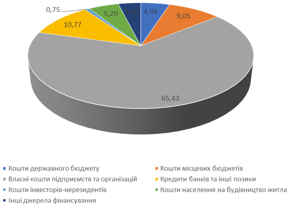
Рис. 2. Структура інвестицій за джерелами фінансування в Україні у 2019 році, %