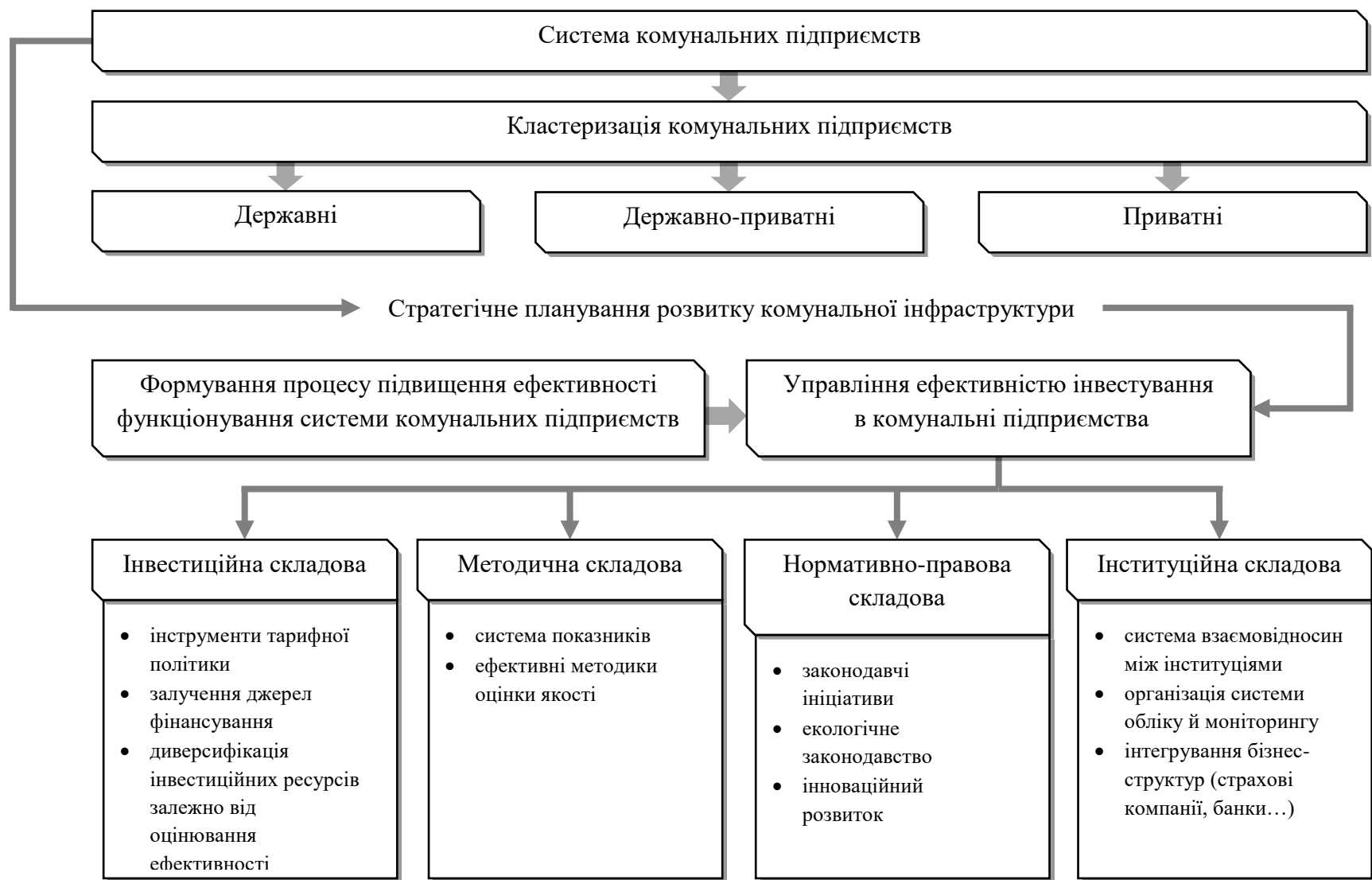
Рис. 3. Інституційний механізм залучення фінансових ресурсів у модернізацію КП