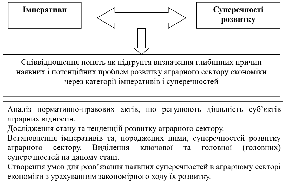
Рис. 3. Розробка моделі аграрної політики

економічних, правових, протекціоністських методів й інструментів реалізації такої політики; чітко визначеній суб'єктності аграрних відносин. Ключовий принцип цієї моделі можна сформулювати у такий спосіб: оскільки земля є власністю народу, то права власності на неї мають обмежуватися на користь суспільства (тенденція до соціалізації економіки). Це пов'язано з тим, що, як показує світовий і вітчизняний досвід трансформації аграрних відносин, порушення підпорядкованості інтересів з боку підсистем, завдає шкоди самій системі аграрних відносин, частинами якої вони є. Логіку алгоритму розробки аграрної політики через категорії імперативів і суперечностей представлено на рис. 3.