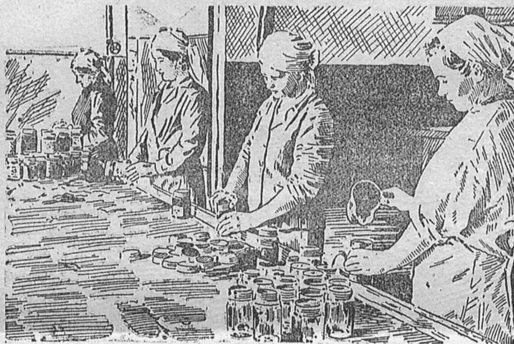
На Житомирському заводі консервованих фруктів.

Ми дійшли до однієї шахти, в яку вели кручені сходи. По них тяглася безупинна черга людей.